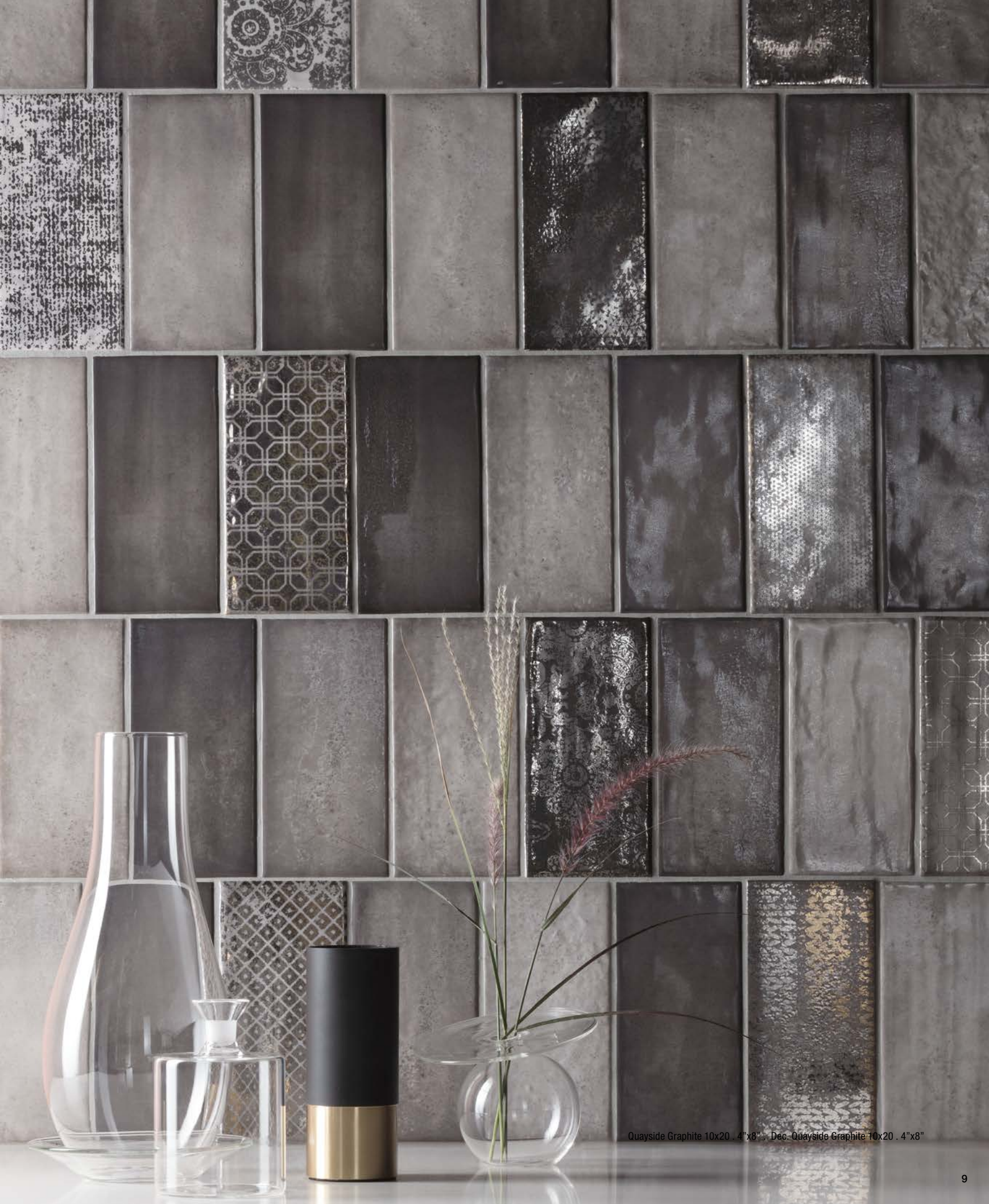
Quayside Graphite 10x20 . 4"x8" . Dec. Quayside Graphite 10x20 . 4"x8"