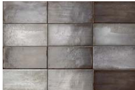
Quayside Graphite 512064 10x20 . 4"x8"