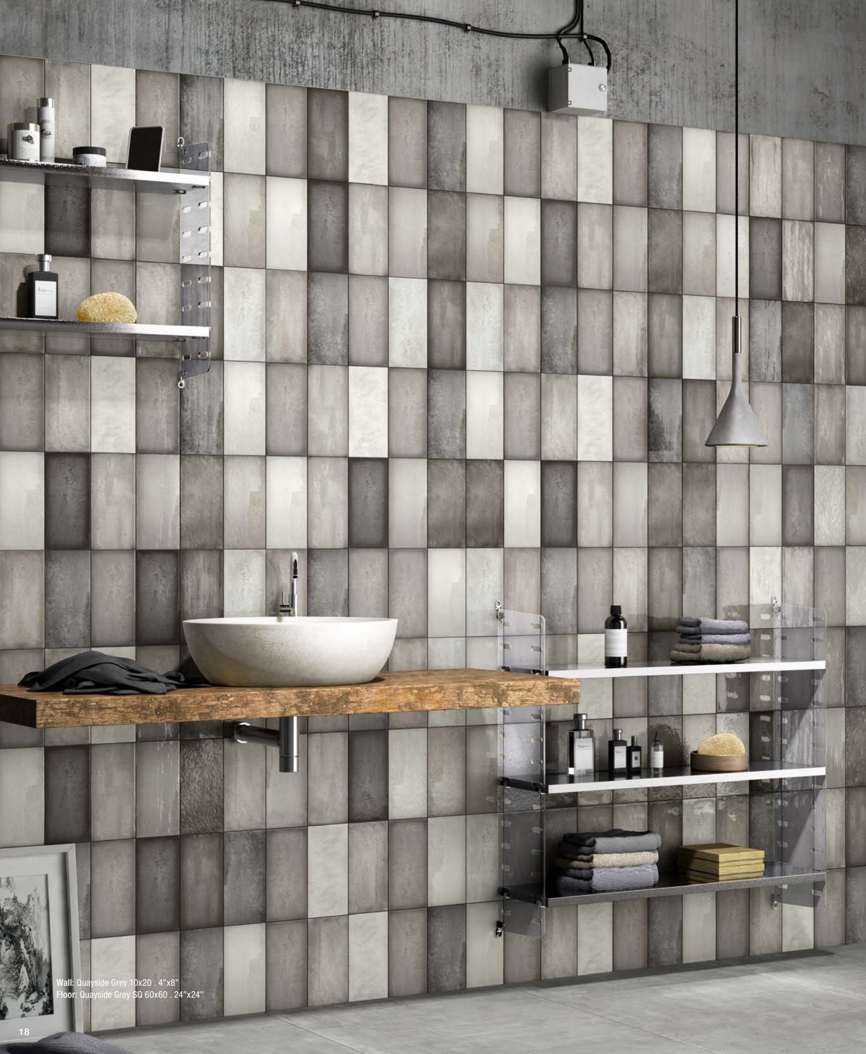
Wall: Quayside Grey 10x20 . 4"x8" Floor: Quayside Grey SQ 60x60 . 24"x24"