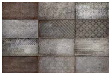
Decorated Quay Graphite 512085 10x20 . 4"x8"