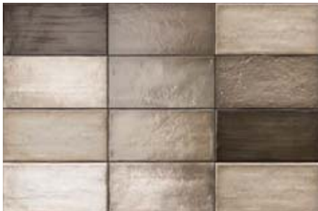
Quayside Brown 512062 10x20 . 4"x8"