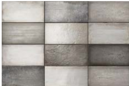
Quayside Grey 512063 10x20 . 4"x8"