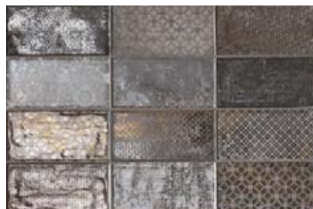
Dec. Quayside Graphite 512064DEC 10x20 . 4"x8"