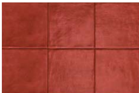
Side Red 563534 20x20 . 8"x8"