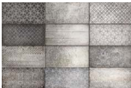
Decorated Quay Grey 512084 10x20 . 4"x8"