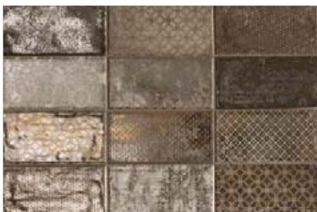
Dec. Quayside Brown 512062DEC 10x20 . 4"x8"