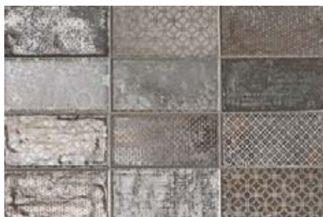
Dec. Quayside Grey 512063DEC 10x20 . 4"x8"