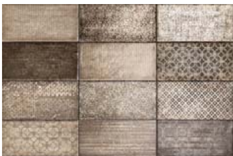
Decorated Quay Brown 512083 10x20 . 4"x8"