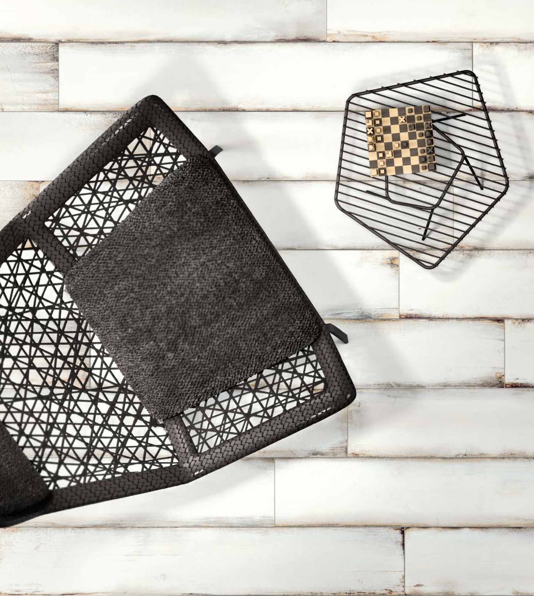
Wooden Quay White SQ 120x20 . 48"x8"