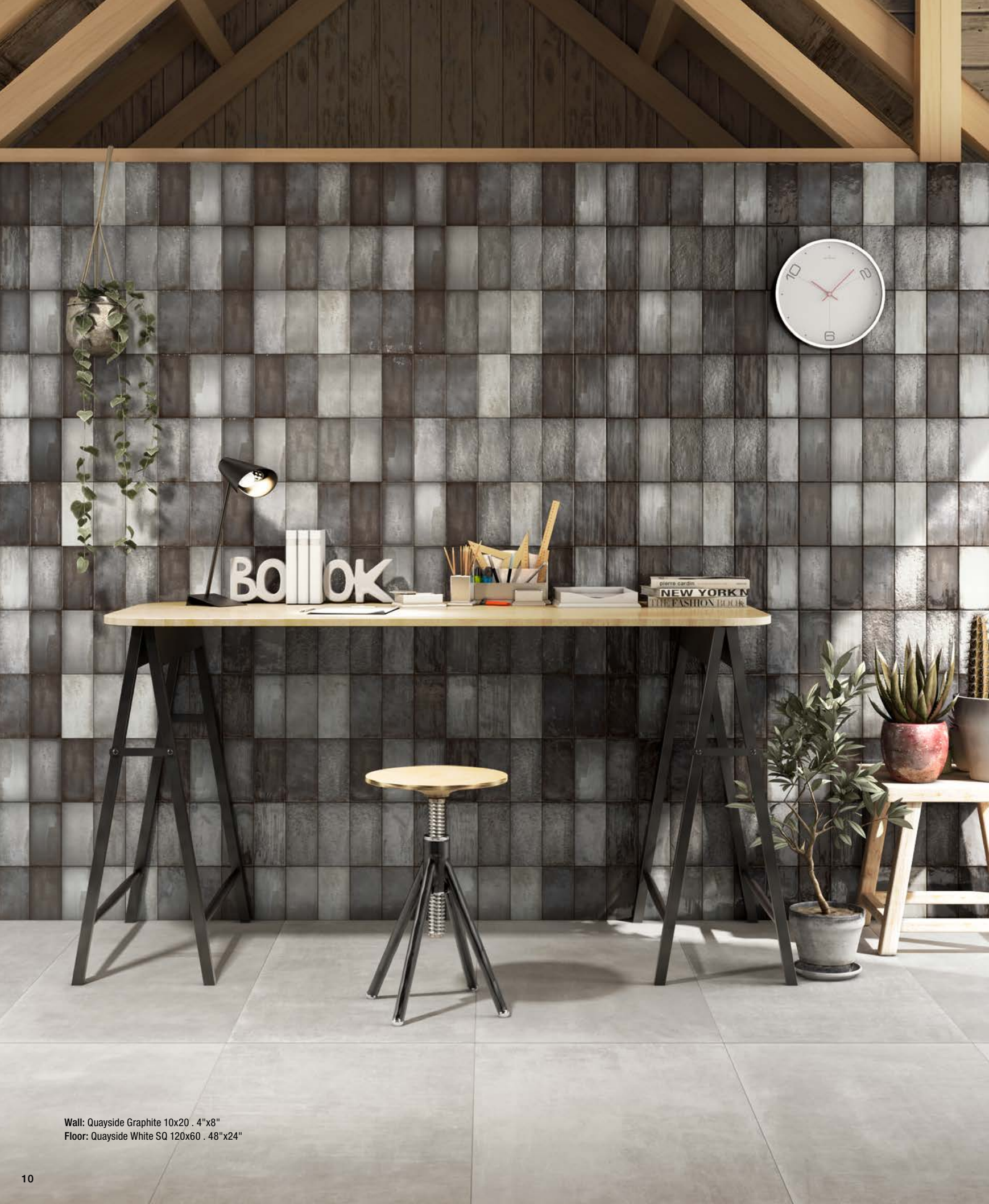
Wall: Quayside Graphite 10x20 . 4"x8" Floor: Quayside White SQ 120x60 . 48"x24"