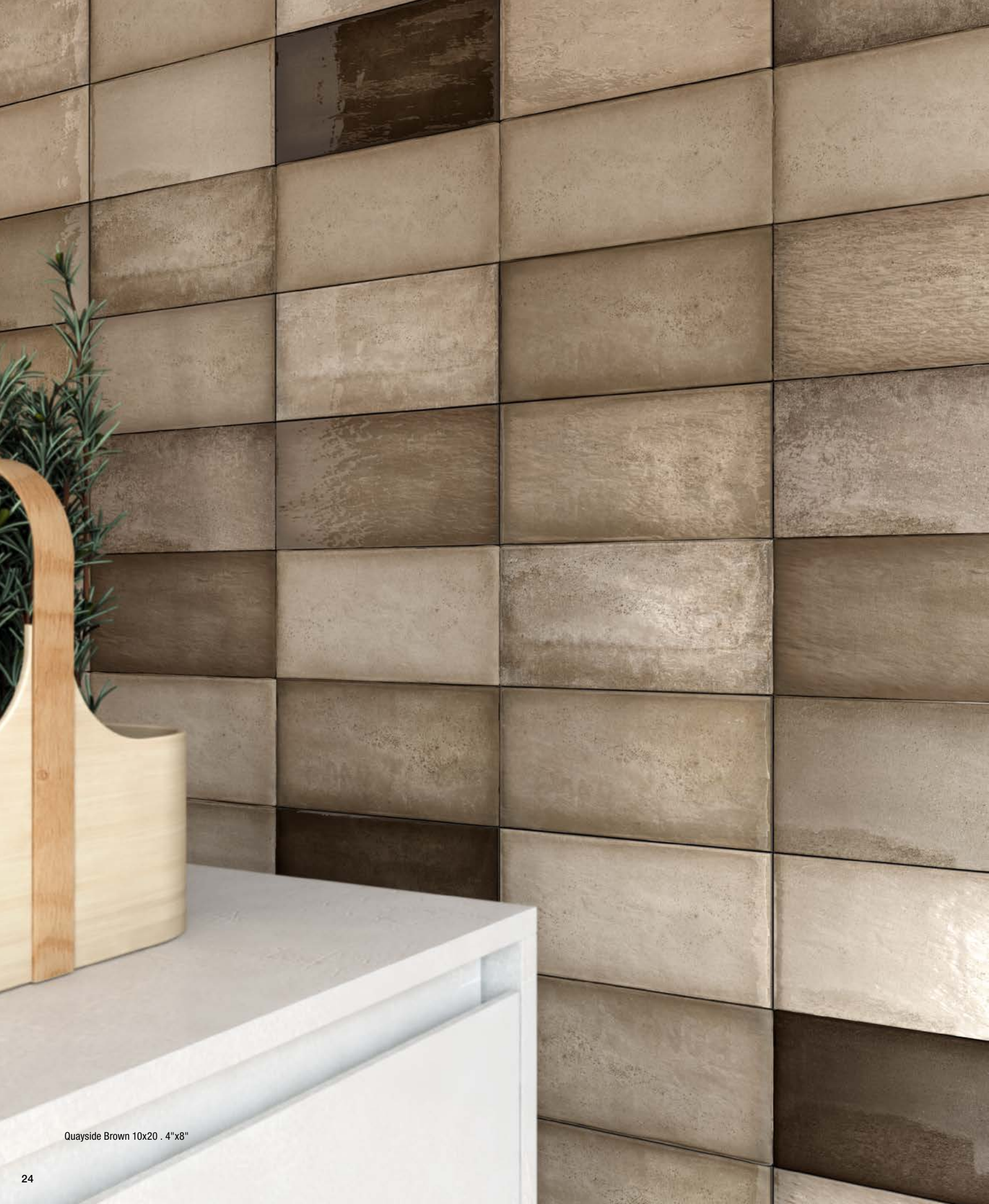
Quayside Brown 10x20 . 4"x8"