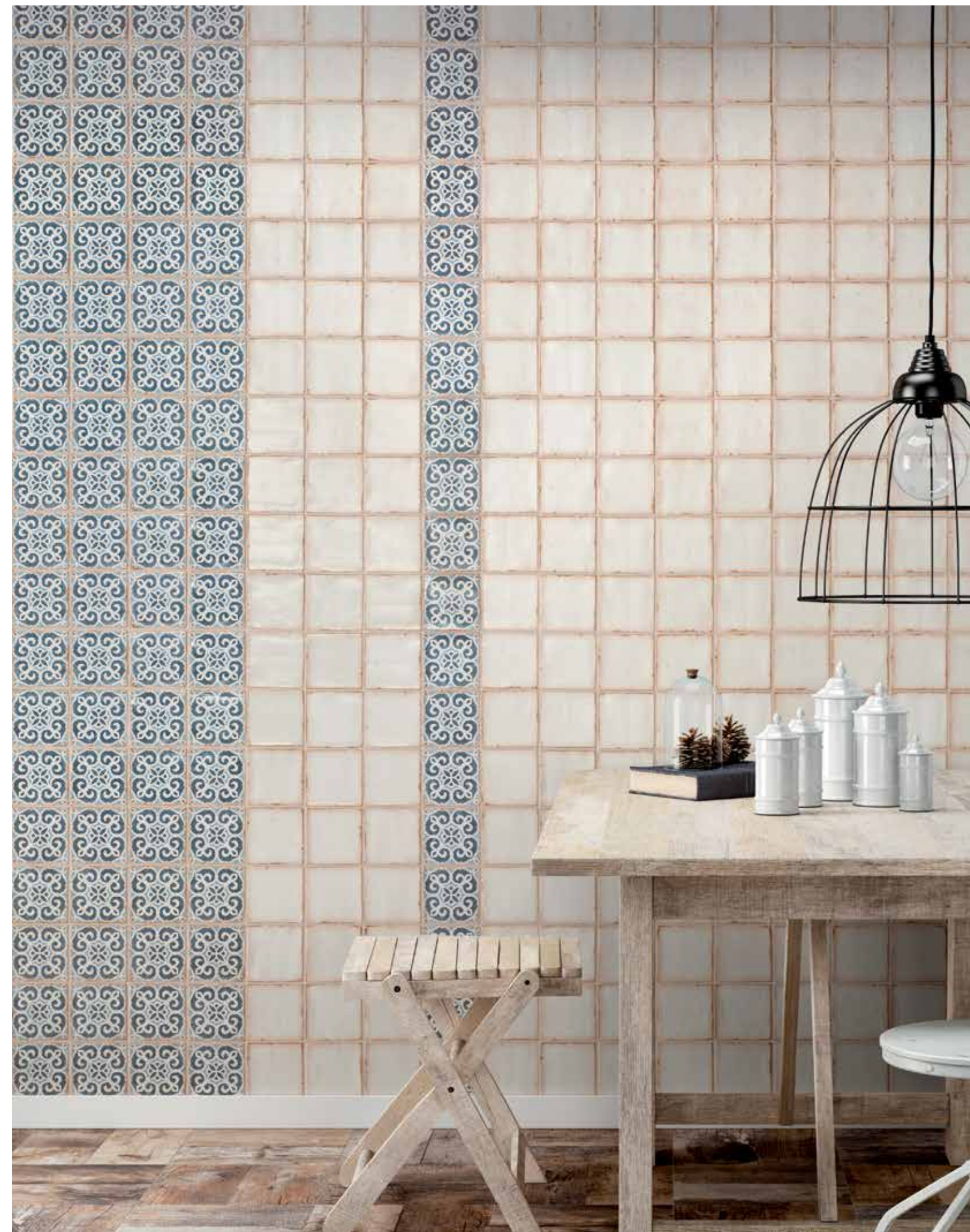
ARCHIVO PLAIN · ARCHIVO BAKULA