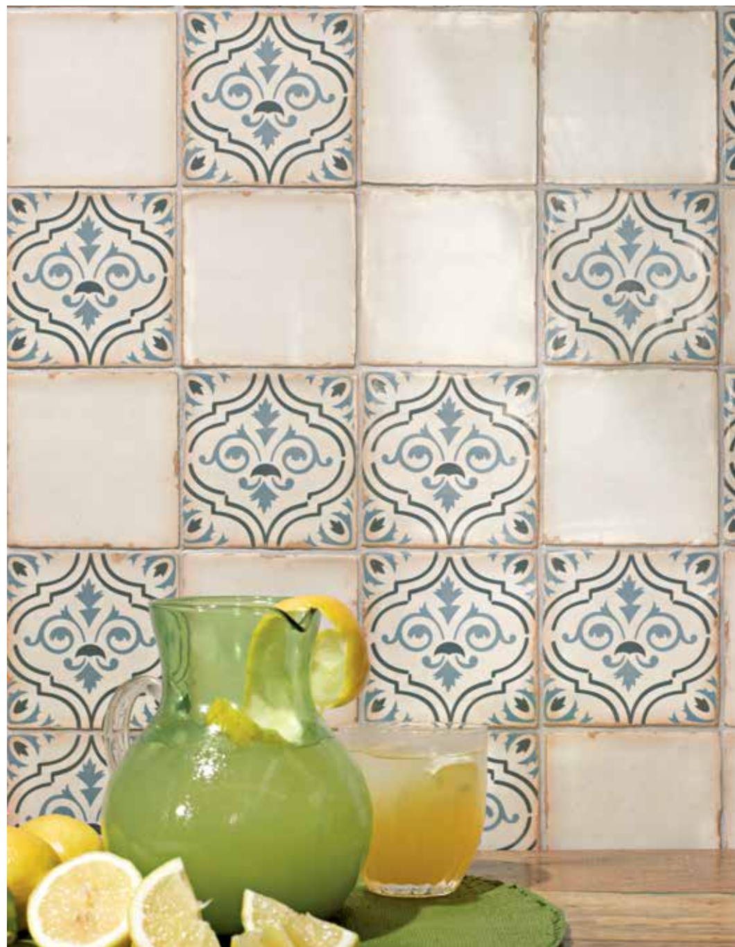
ARCHIVO PLAIN · ARCHIVO FLEUR DE LIS