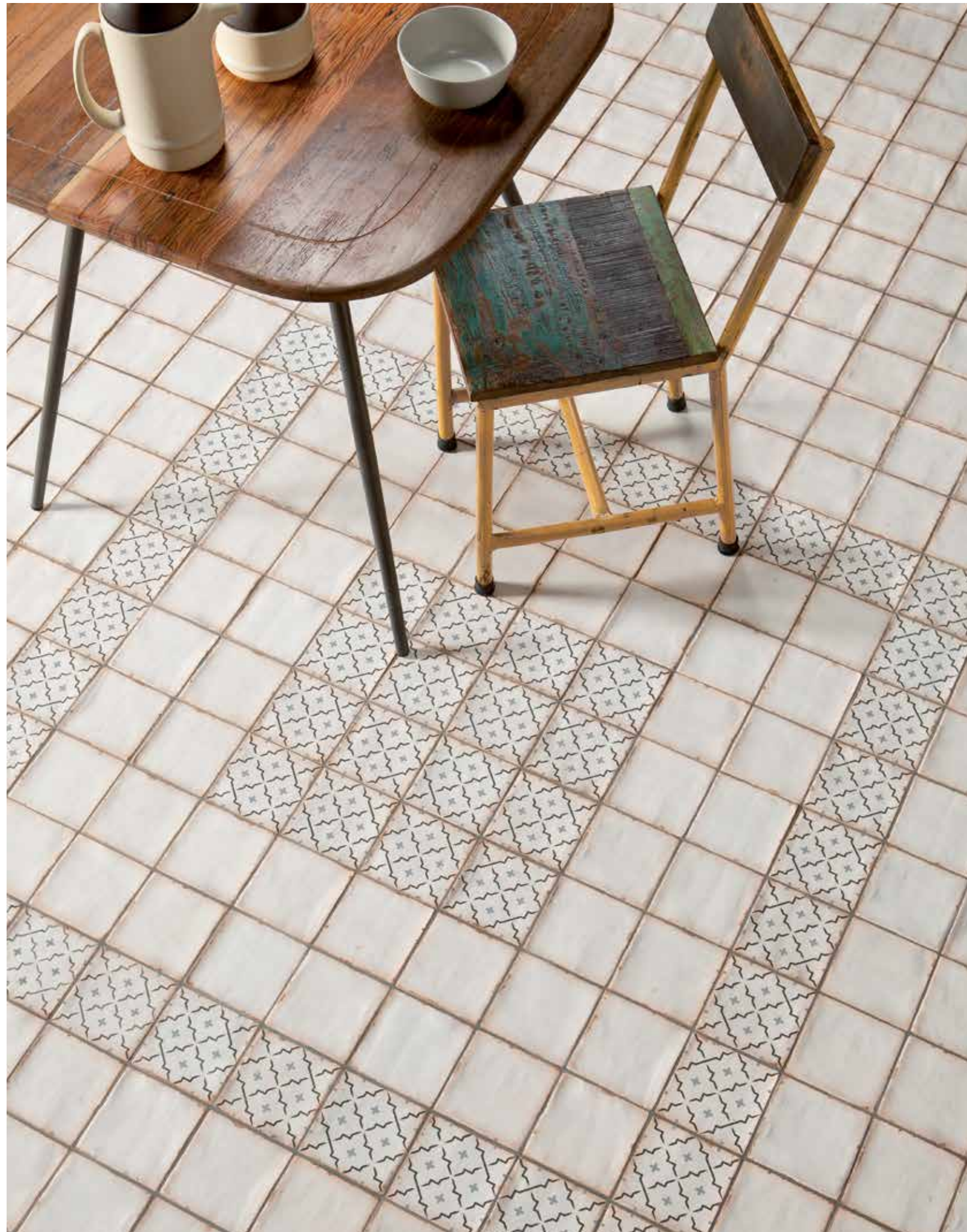
ARCHIVOLATTICE / ARCHIVOPLAIN