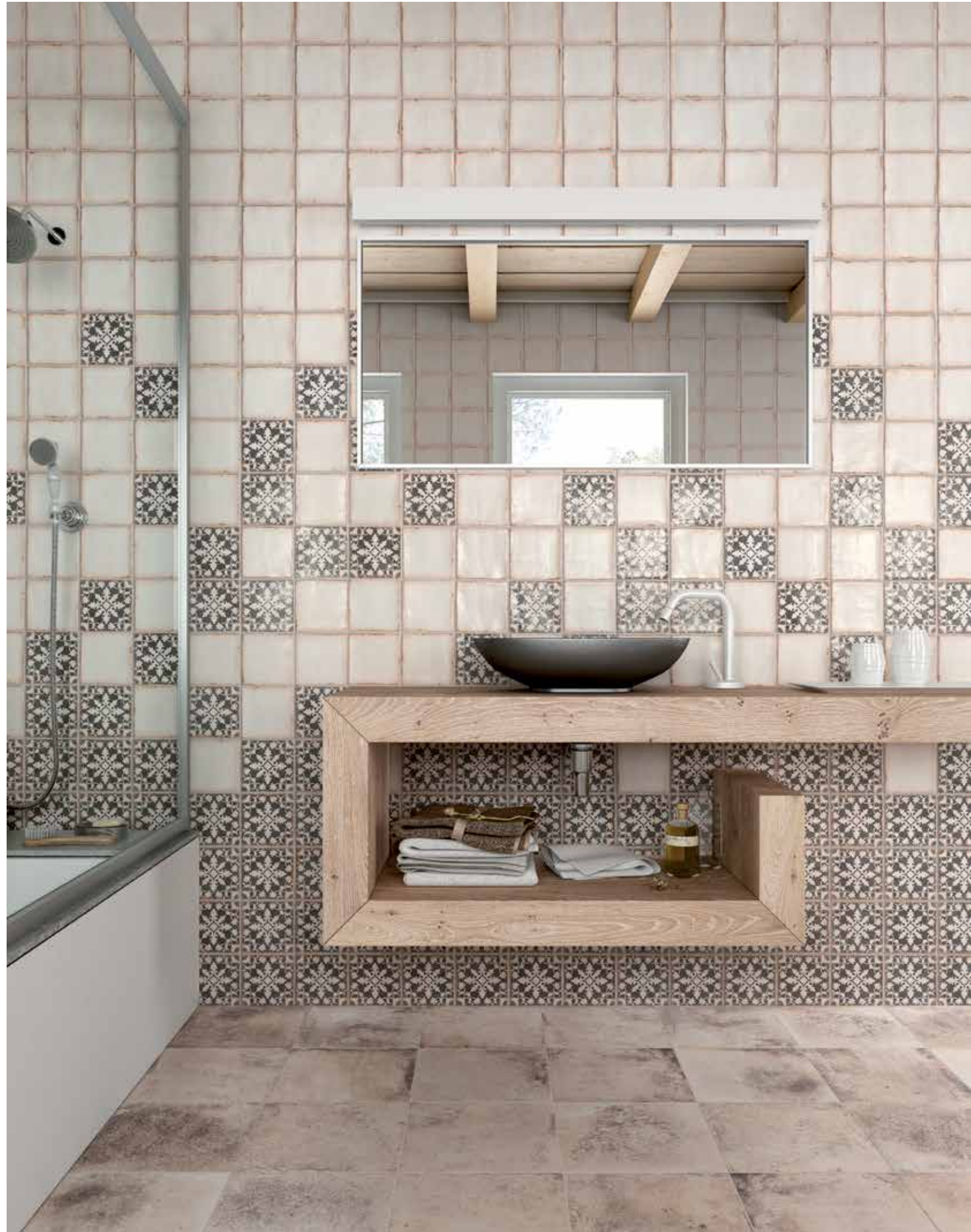
ARCHIVO PLAIN · ARCHIVO ZAHRA