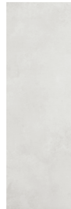
Track Blanco 30x90 W90D KJUPG000