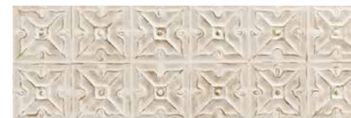
Track Art Beige 30x90 W90H KJUPG021