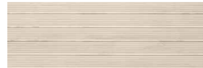
Track Concept Beige 30x90 W90G KJUPG011 Número de Caras