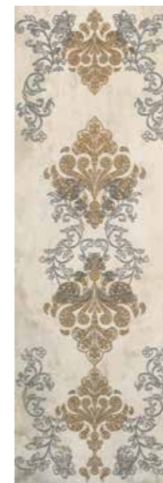
Decor Sasha Light 30x90 D620 GJUPG00L