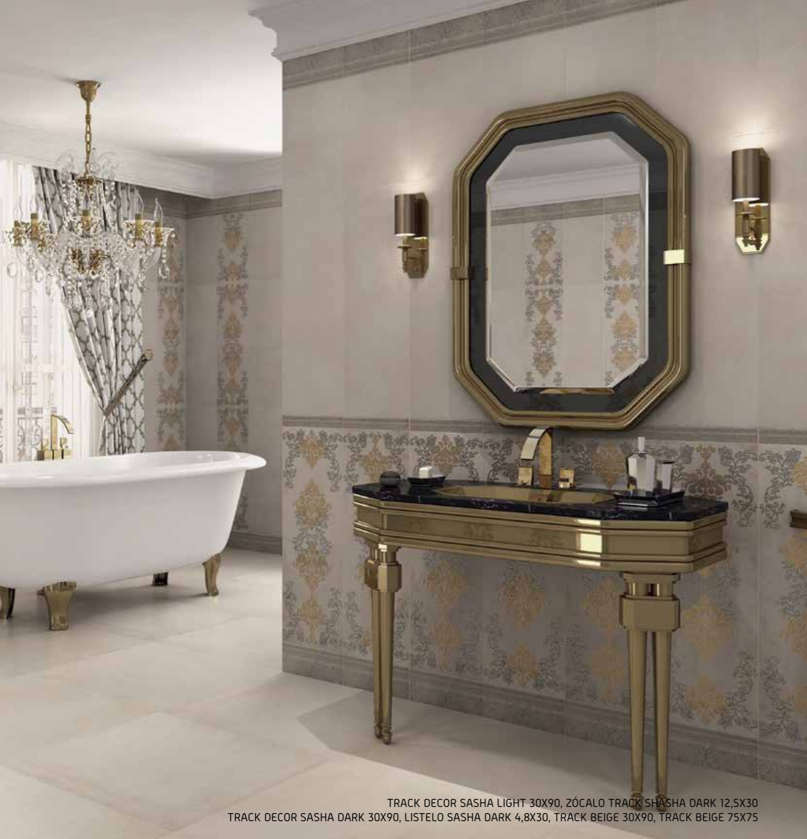
TRACK DECOR SASHA LIGHT 30X90, ZÓCALO TRACK SHASHA DARK 12,5X30 TRACK DECOR SASHA DARK 30X90, LISTELO SASHA DARK 4,8X30, TRACK BEIGE 30X90, TRACK BEIGE 75X75