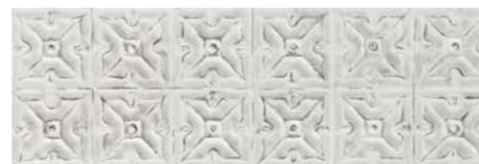
Track Art Blanco 30x90 W90H KJUPG020