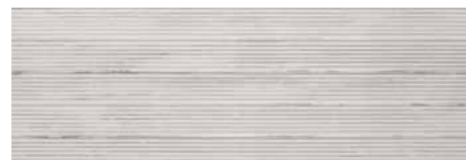
Track Concept Blanco 30x90 W90G KJUPG010