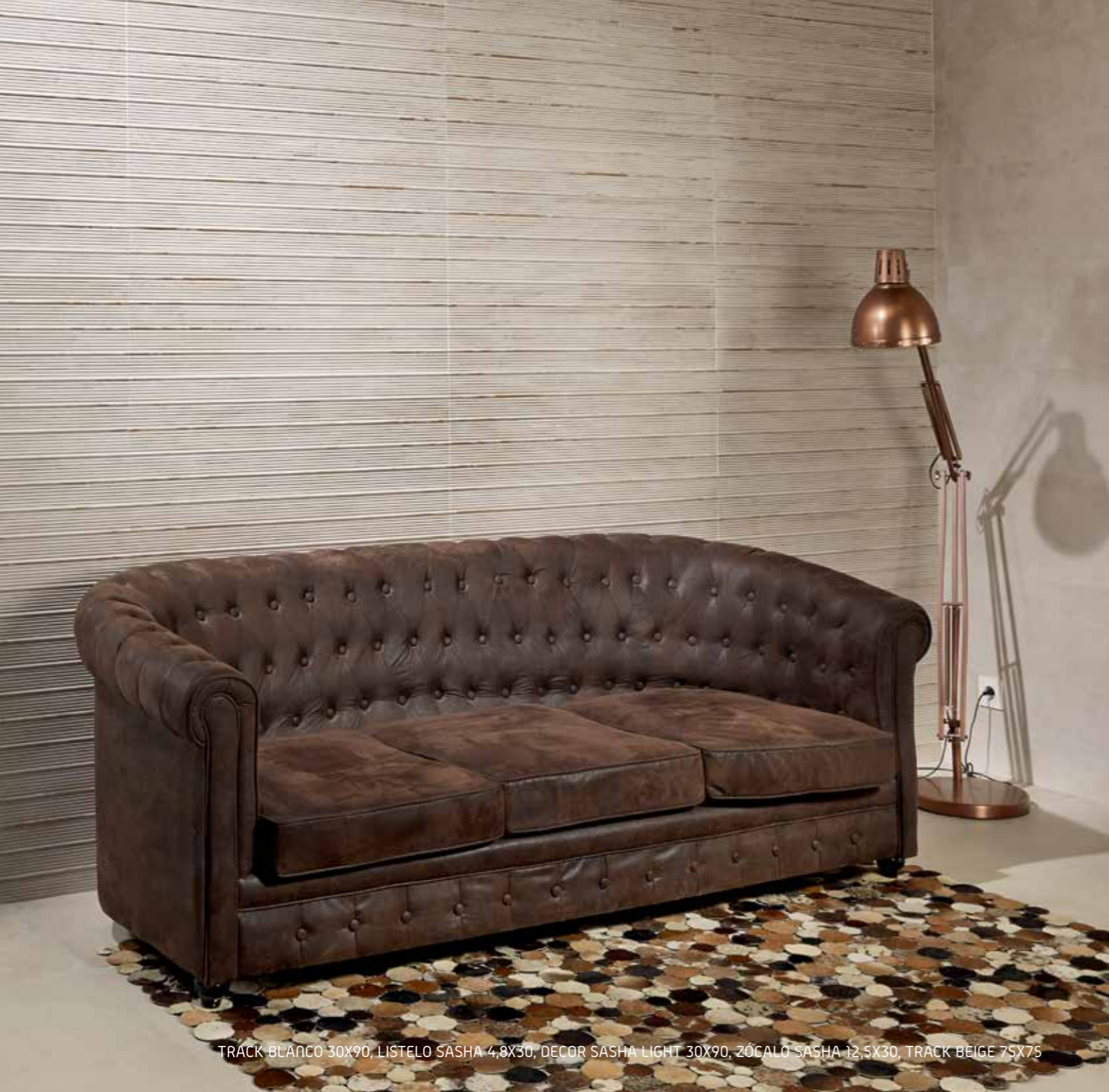
TRACK BLANCO 30X90, LISTELO SASHA 4,8X30, DECOR SASHA LIGHT 30X90, ZÓCALO SASHA 12,5X30, TRACK BEIGE 75X75