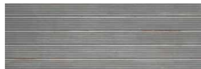
Track Concept Grafito 30x90 W90G KJUPG00J