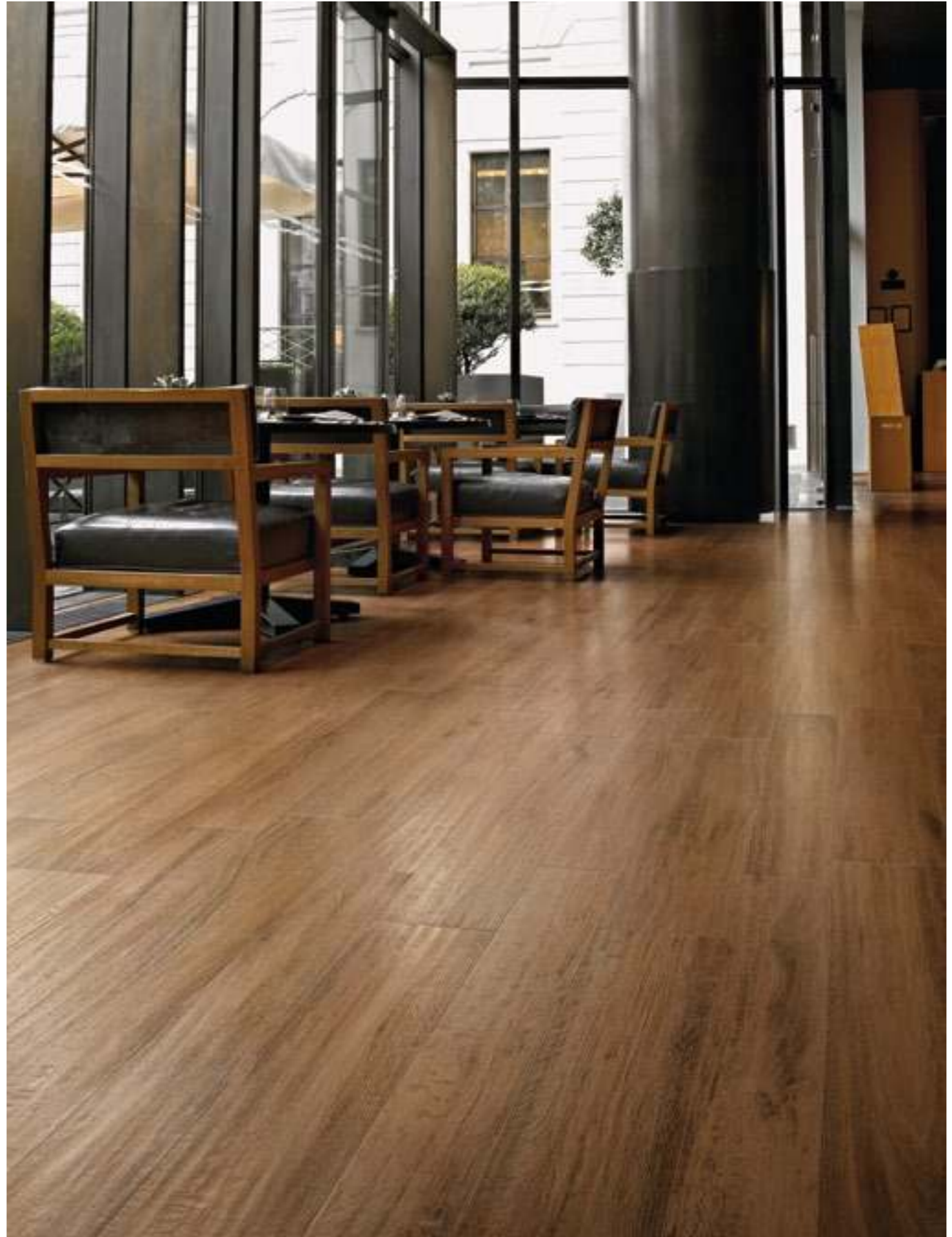
Wood Nut 20120, Wood Nut 15120