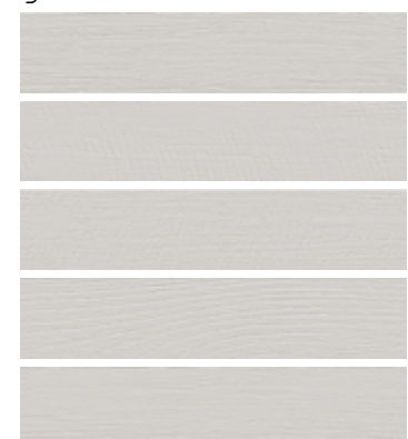
grigio matt PRT104M ■05