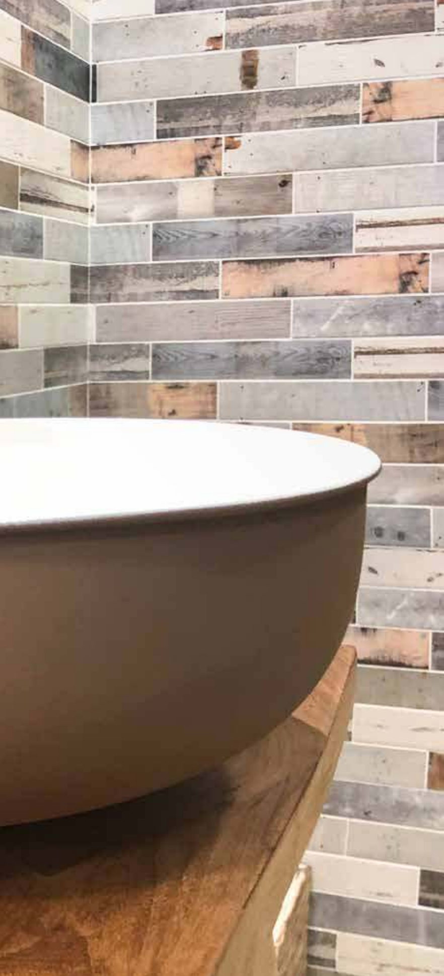
bianco matt PRT101M ■05