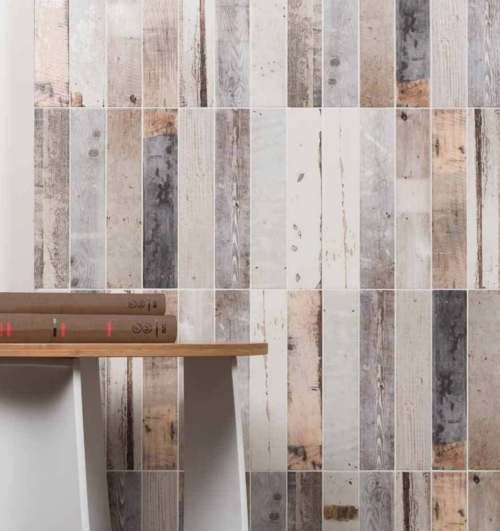
porticciolo brezza di terra