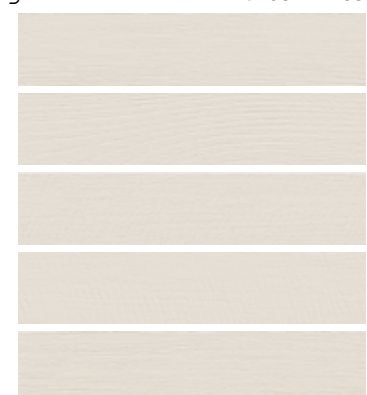
beige matt PRT103M ■05