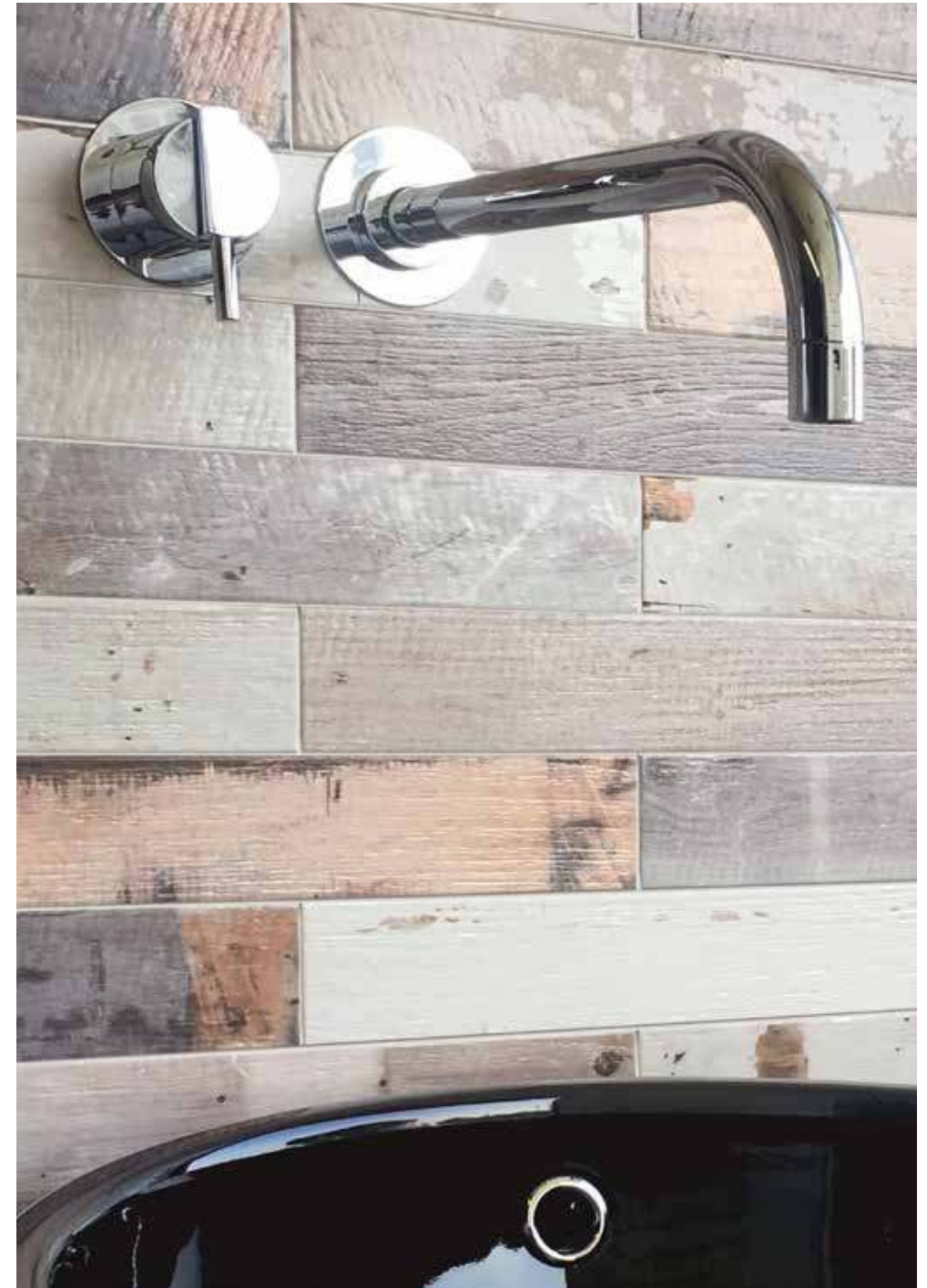
porticciolo brezza di terra