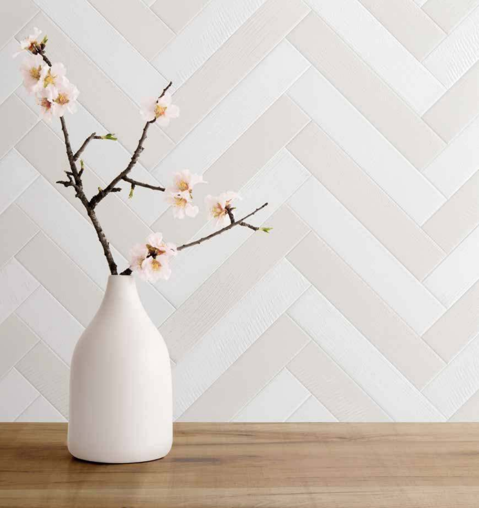
porticciolo porticciolo | bianco matt, beige matt