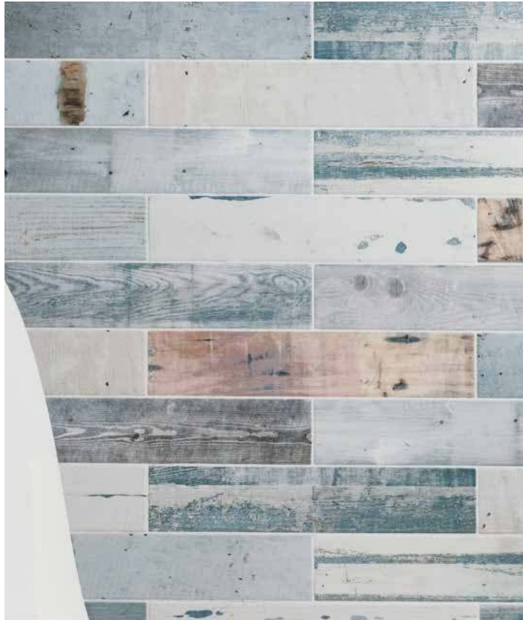
porticciolo brezza di mare