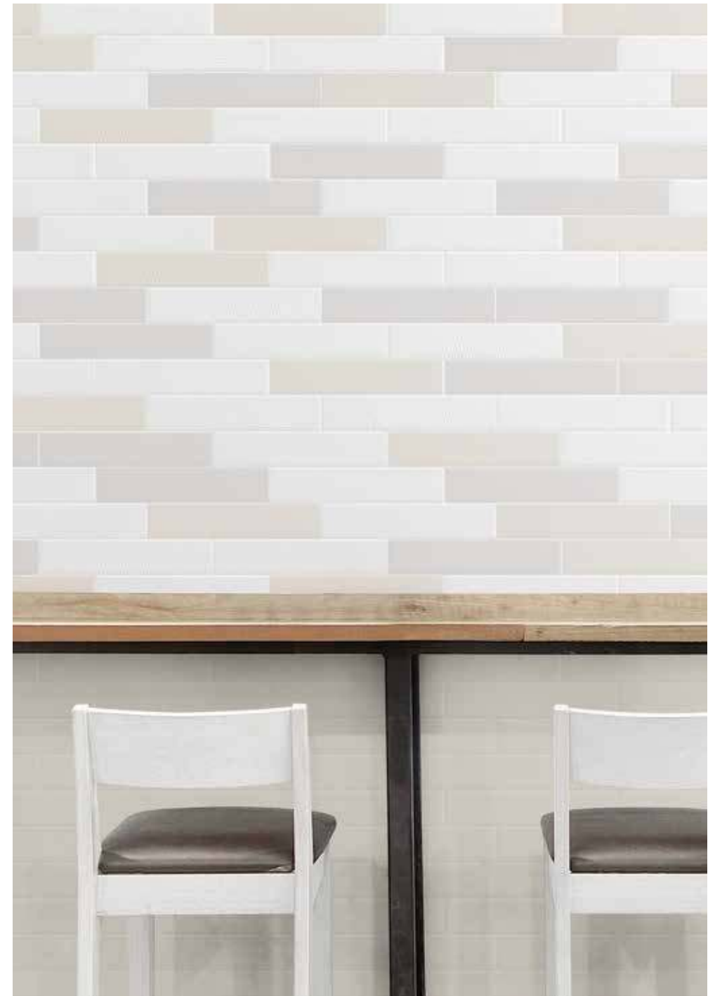
porticciolo | bianco matt, beige matt, grigio matt