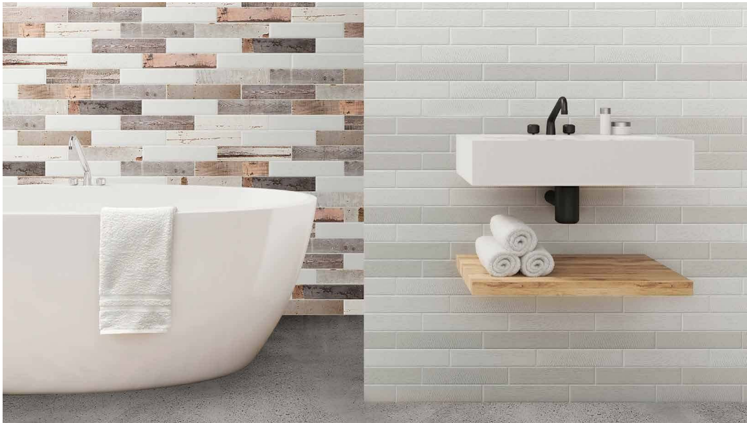
porticciolo porticciolo | bianco matt, grigio matt brezza di terra