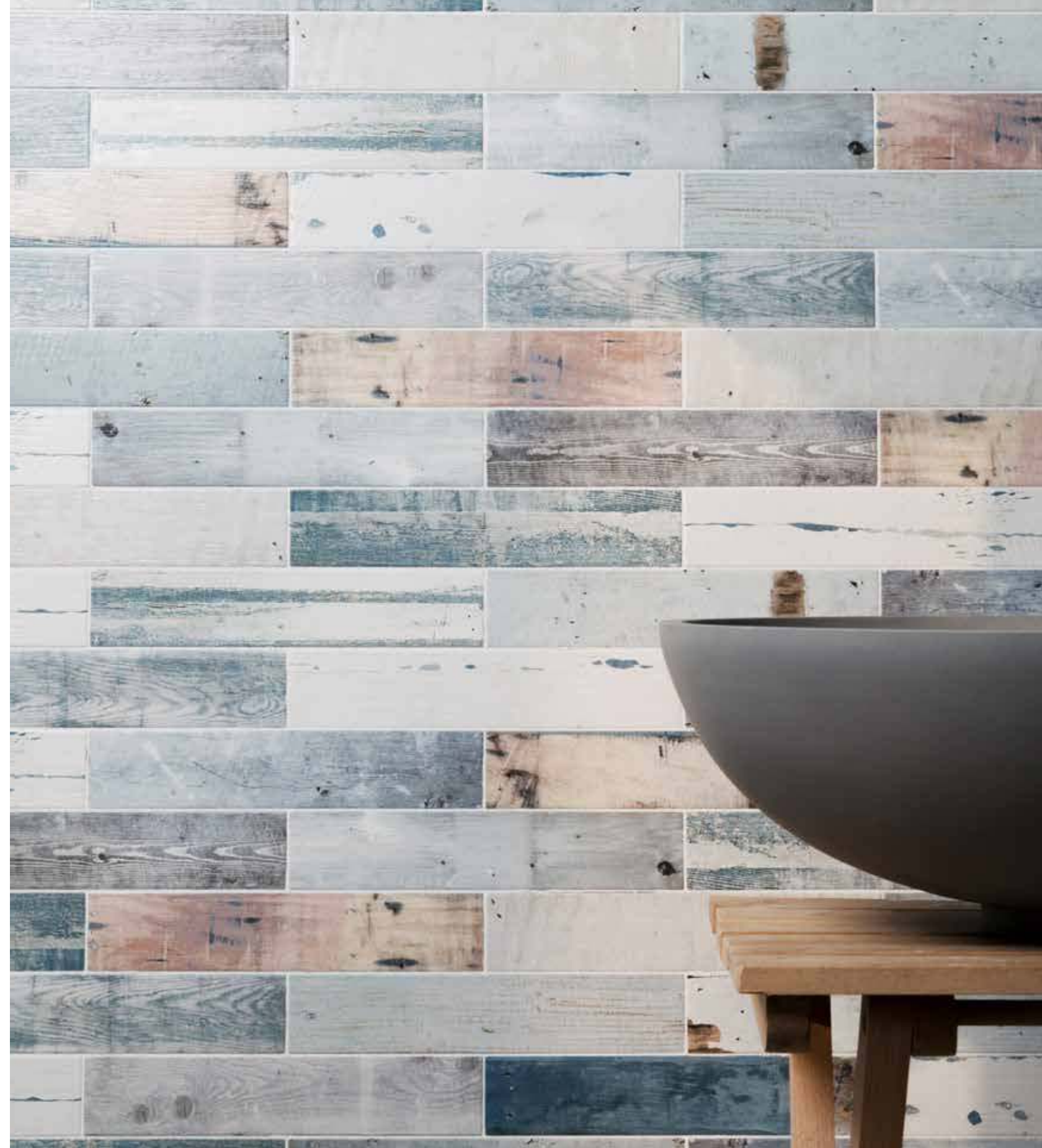
porticciolo brezza di mare