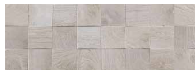
TACO OXFORD ACERO 31,6x90x1,25cm P3470661 / 100135552 G271 Butech recomienda junta / Butech recommends joint: Colorstuk Rapid n Cemento B22502004 / 100004297