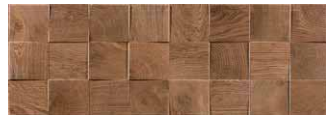
TACO OXFORD COGNAC 31,6x90x1,25cm P3470677 / 100135554 G271 Butech recomienda junta / Butech recommends joint: Colorstuk Rapid n Moka B21522220 / 100060549