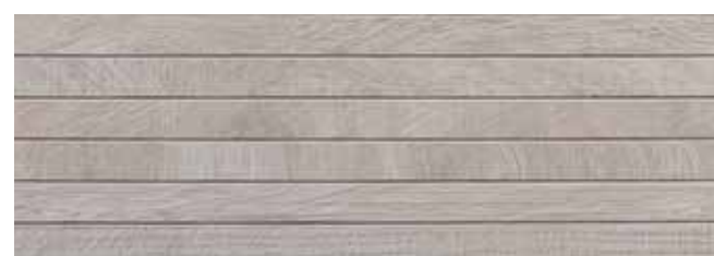
LISTON OXFORD ACERO 31,6x90x1,1cm P3470675 / 100135532 G271 Butech recomienda junta / Butech recommends joint: Colorstuk Rapid n Cemento B22502004 / 100004297