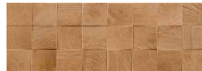
TACO OXFORD NATURAL 31,6x90x1,25cm P3470678 / 100135555 G271 Butech recomienda junta / Butech recommends joint: Colorstuk Rapid n Tabaco B22502011 / 100004304