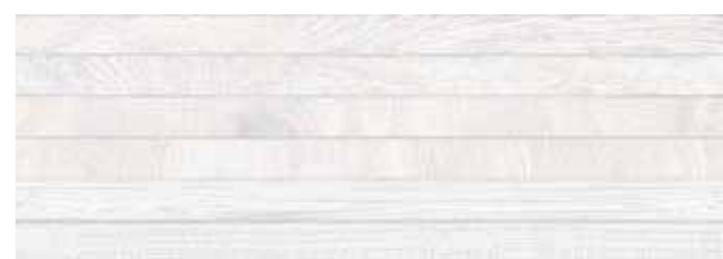
LISTON OXFORD BLANCO 31,6x90x1,1cm P3470671 / 100135533 G271 Butech recomienda junta / Butech recommends joint: Colorstuk Rapid n Gris B22502013 / 100004305