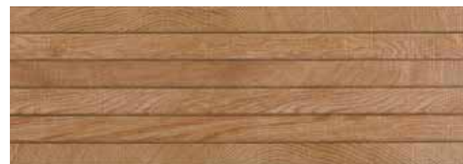
LISTON OXFORD NATURAL 31,6x90x1,1cm P3470657 / 100135535 G271 Butech recomienda junta / Butech recommends joint: Colorstuk Rapid n Tabaco B22502011 / 100004304