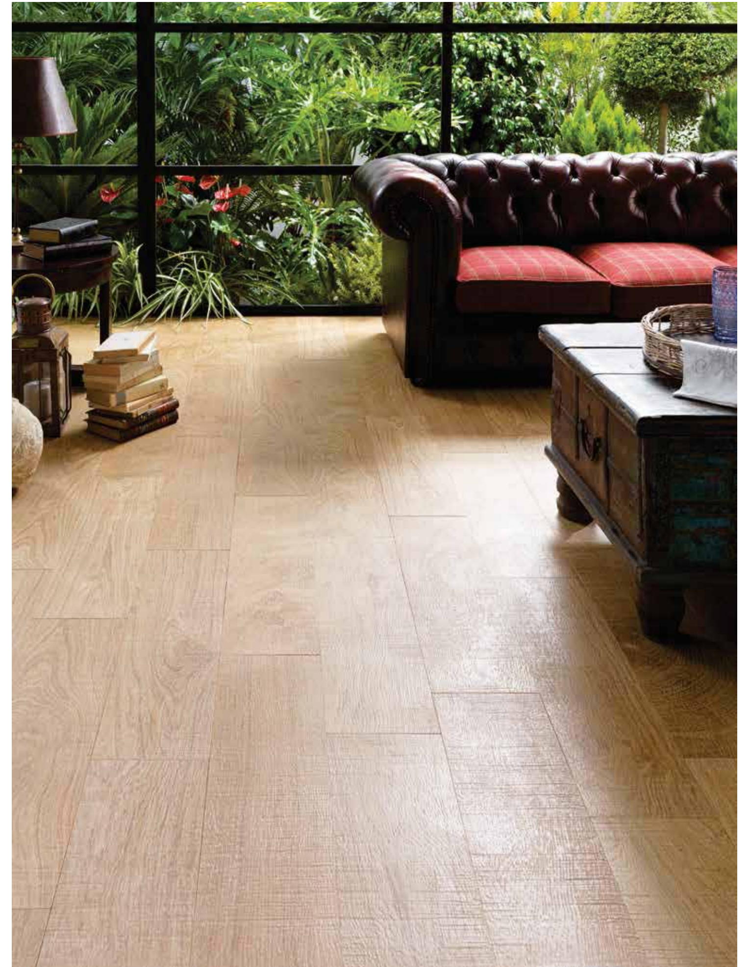
# LITTLE OXFORD NATURAL 21,5x65,9cm

LITTLE OXFORD NATURAL P-R G359 21,5x65,9x1,1cm P1350001 / 100173864 Butech recomienda junta / Butech recommends joint: Colorstuk Rapid n Tabaco B22502011 / 100004304