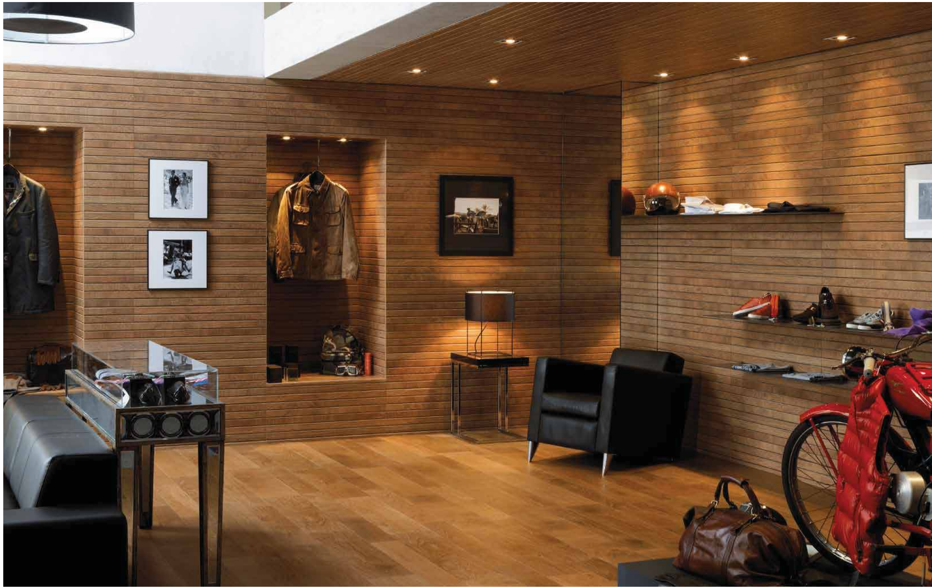
# LISTON OXFORD COGNAC 31.6x90cm