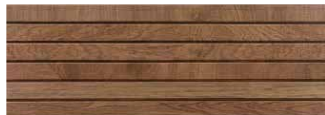
LISTON OXFORD COGNAC 31,6x90x1,1cm P3470662 / 100135534 G271 Butech recomienda junta / Butech recommends joint: Colorstuk Rapid n Moka B21522220 / 100060549