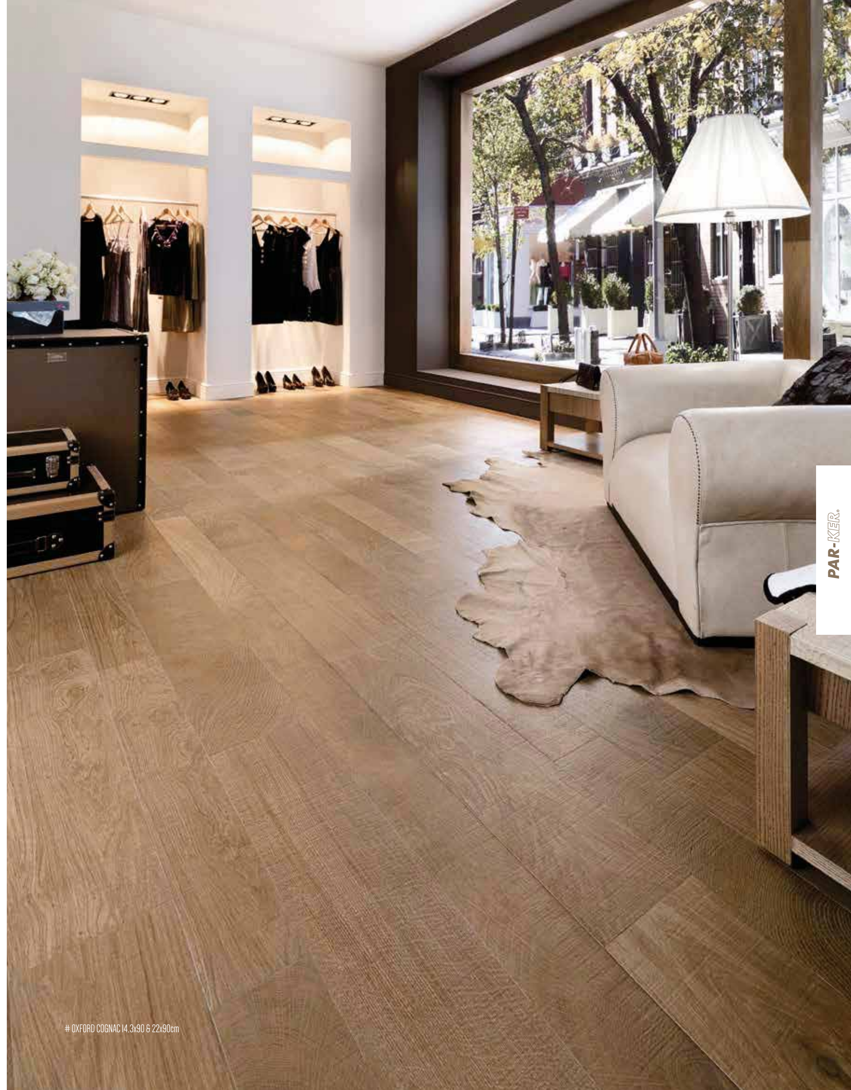
# OXFORD COGNAC 14,3x90 & 22x90cm