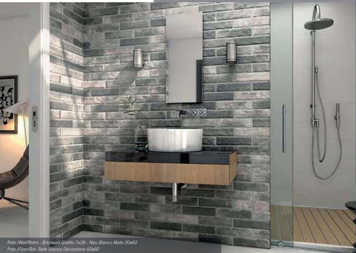
Rvto./Wall/Rvtm.: Brickwall Grafito 7x28 - Neu Blanco Mate 20x60 Pvto./Floor/Sol: Style Blanco Decorstone 60x60