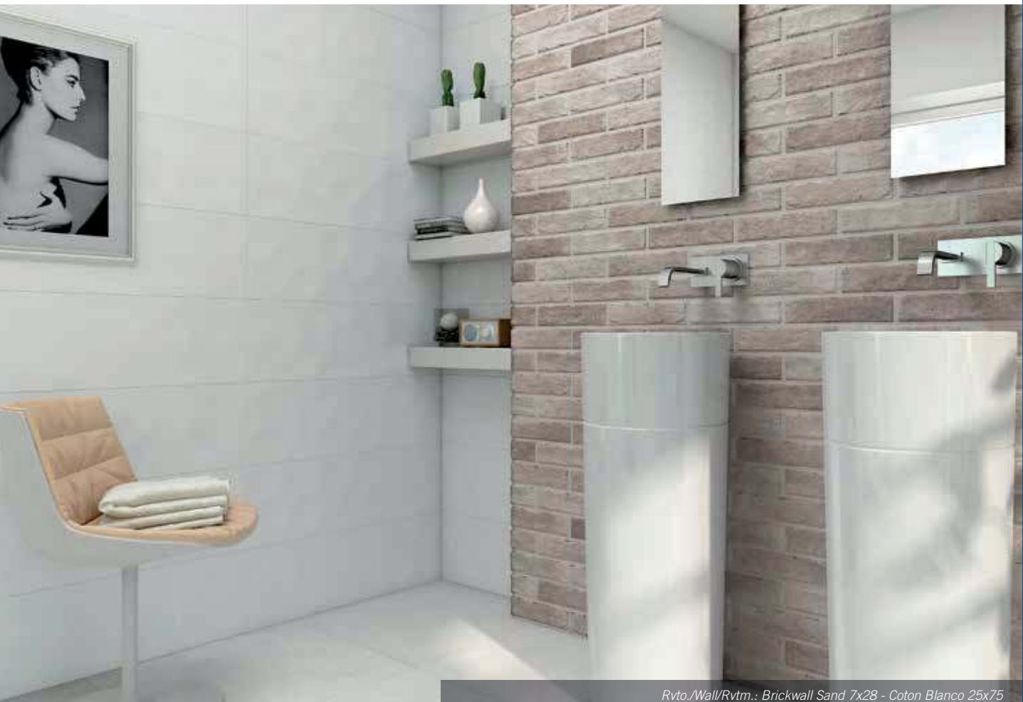
Rvto./Wall/Rvtm.: Brickwall Sand 7x28 - Coton Blanco 25x75 Pvto./Floor/Sol: Style Marfil Decorstone 60x60