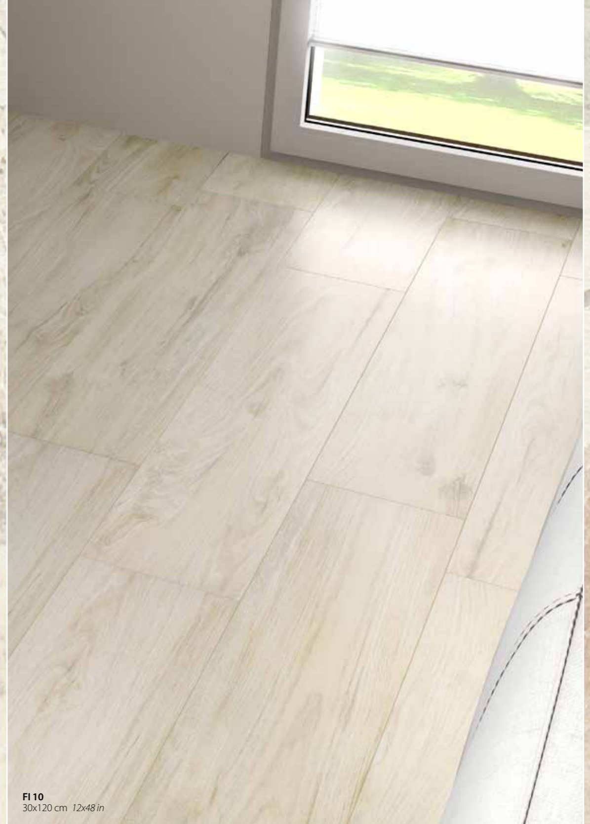
FI 10 30x120 cm 12x48 in