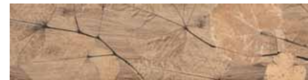
Foliage / FI 9 20x80 cm 8x32 in 095