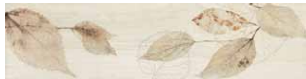
Foliage / FI 10 20x80 cm 8x32 in 095