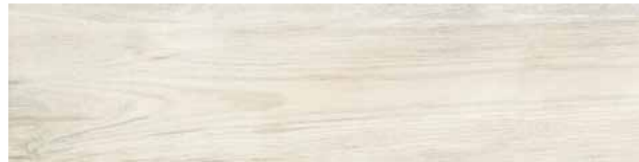
FI 10 30x120 cm 12x48 in 089