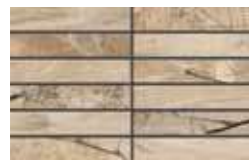
Mosaico / FI 1 20x32 cm 8x12 5/8 in 248