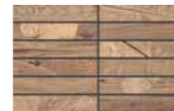
Mosaico / FI 9 20x32 cm 8x12 5/8 in 248