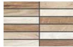
Foliage Mix 20x32 cm 8x12 5/8 in 265