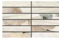
Mosaico / FI 10 20x32 cm 8x12 5/8 in 248