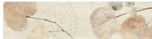
Foliage Mix 20x32 cm 8x12 5/8 in 265