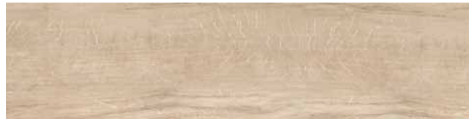
FI 1 30x120 cm 12x48 in 089