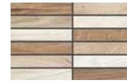
Foliage Mix 20x32 cm 8x12 5/8 in 265