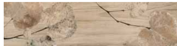
Foliage / FI 1 20x80 cm 8x32 in 095