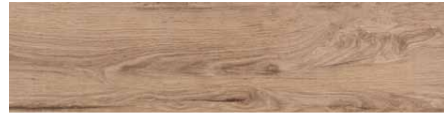
FI 9 30x120 cm 12x48 in 089