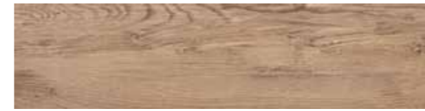
FI 9 20x80 cm 8x32 in 073