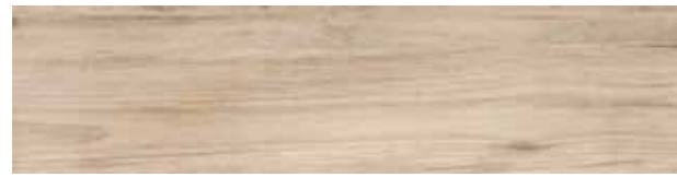
FI 1 20x80 cm 8x32 in 073