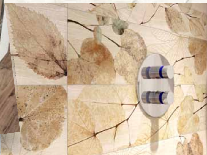
Fl 9 - Mosaico / Fl 9 - Fl 10 - Foliage / Fl 10