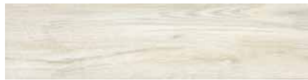
FI 10 20x80 cm 8x32 in 073