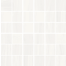
30x30 - 11,8"x11,8" 6000990 satin 17 ▲