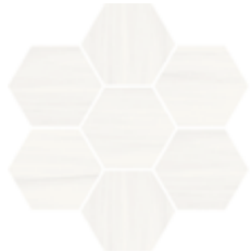
30x28 - 11,8"x11,1" 6000989 satin 17 ▲