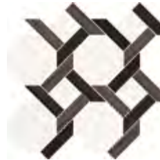
32x30,5 - 12,6"x12" 60007831 lusso 39 ▲