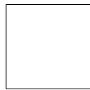
60x60 - 23,6"x23,6"