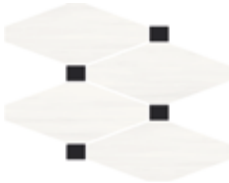
29,4x22 - 11,6"x8,7" 6000784 lusso 19 ▲