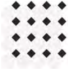
30x30 - 11,8"x11,8" 6000778 satin 33 ▲