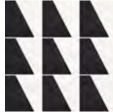
30x30 - 11,8"x11,8" 60007751 lusso 17 ▲