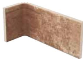
Angolo interno 10x20x10 4"x8"x4" Inside corner Innen-Ecke Angle intérieur 030