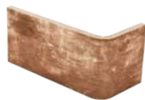
Angolo esterno 10x20x10 4"x8"x4" Out corner Aussenecke Angle extérieur 030

Pezzi Speciali Special Pieces • Formteile • Pièces spéciales Disponibili nei colori: - Available on colours: - Formteile in den Farben: - Disponibles dans les couleurs: CA 6 - CA 10 - CA 8