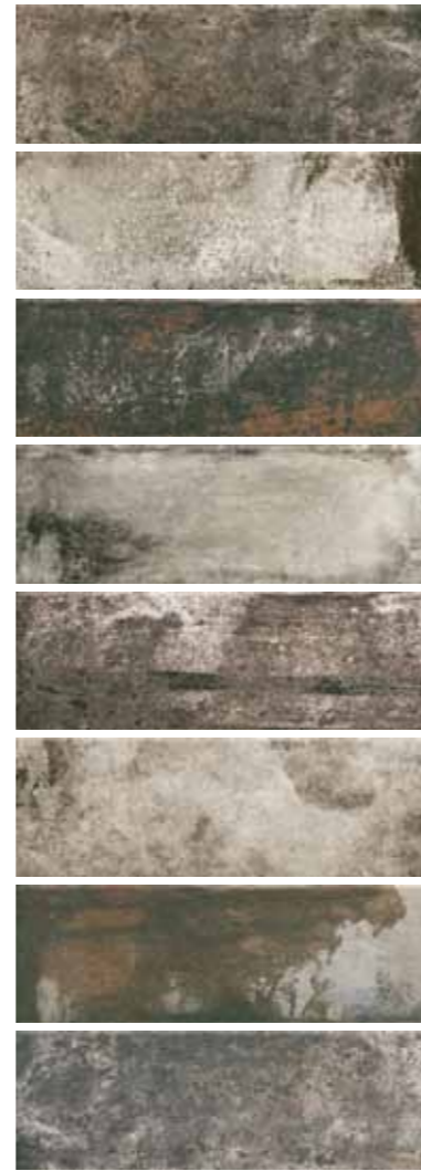
CA 8 / Nero 10x30 4"x12" 092

Pezzi Speciali Special Pieces • Formteile • Pièces spéciales Disponibili nei colori: - Available on colours: - Formteile in den Farben: - Disponibles dans les couleurs: CA 6 - CA 10 - CA 8