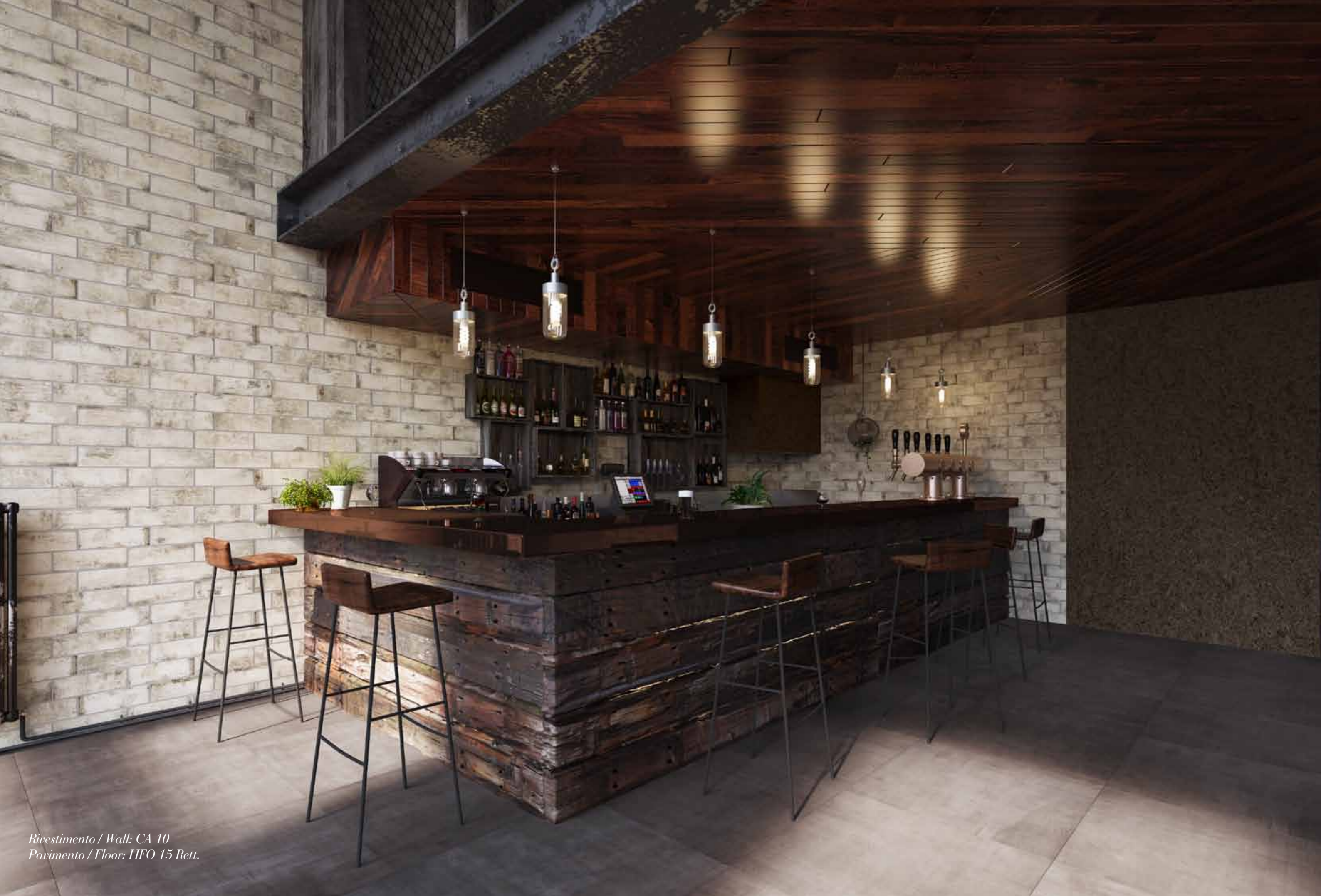
Rivestimento / Wall: CA 10 Pavimento / Floor: HFO 15 Rett.