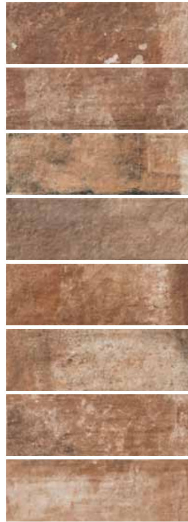
CA 6 / Rosso 10x30 4"x12" 092