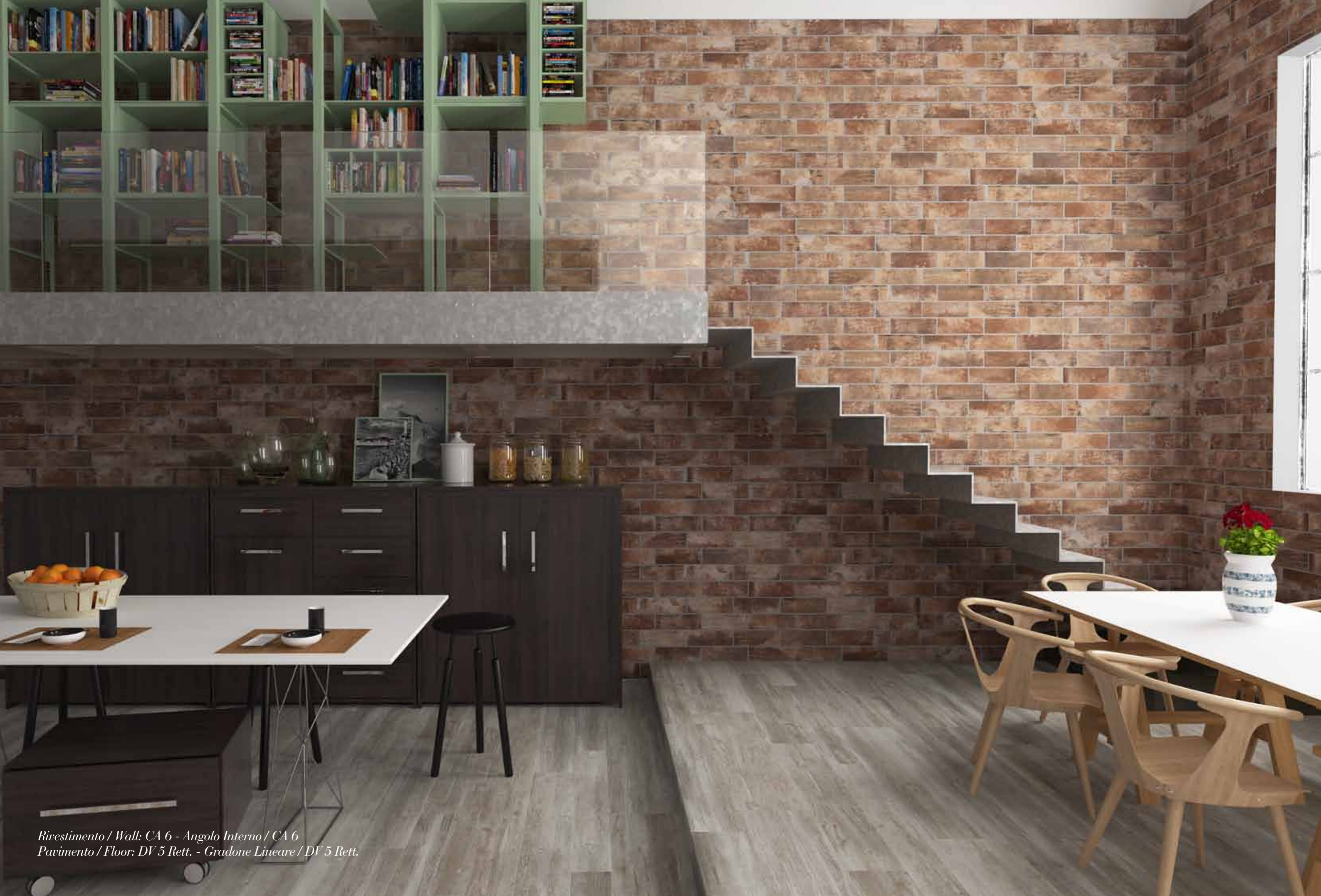
Rivestimento / Wall: CA 6 - Angolo Interno / CA 6 Pavimento / Floor: DV 5 Rett. - Gradone Lineare / DV 5 Rett.