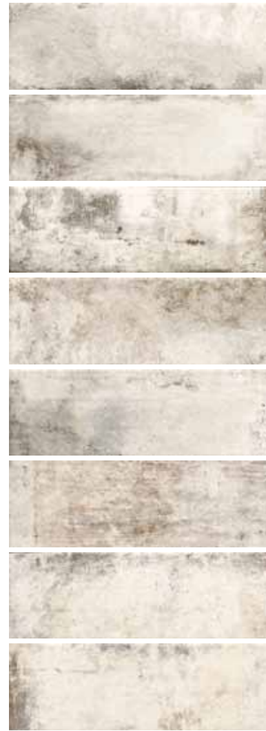
CA 10 / Bianco 10x30 4"x12" 092