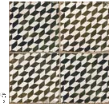
15816 FS ESPIGA B-14 (45x45) (4-1-H) **** R-9