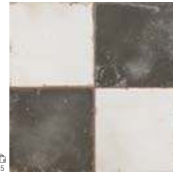
15077 FS DAMERO-N B-14 (45x45) (4-1-H) **** R-9