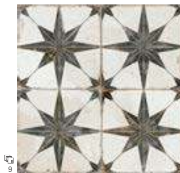
19136 FS STAR-N B-14 (45x45) (4-1-H) ***** R9