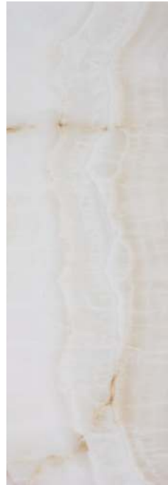
BRG610 DOREX 40x120 B44 BEIGE