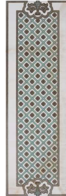
BRG610-563 ALEGORIA B P47 40x120 BEIGE