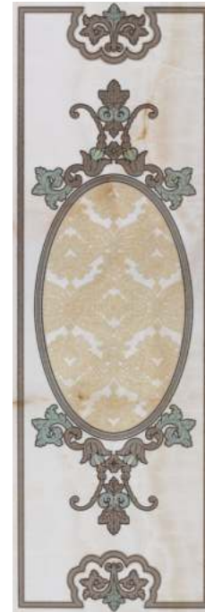
BRG610-562 ALEGORIA A P47 40x120 BEIGE