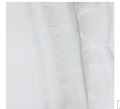
DNK710 DOREX 58,5x58,5 GRIS B19