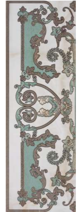
BRG610-564 ALEGORIA C P47 40x120 BEIGE