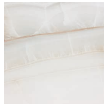
DNK610 DOREX 58,5x58,5 BEIGE B19