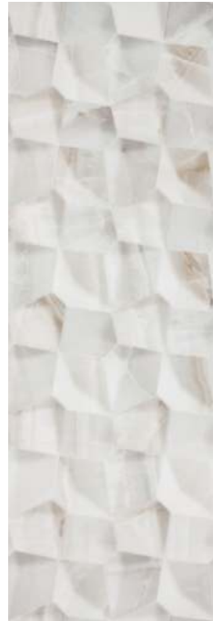
BRH990 VARY DOREX 40x120 B45 IRIS