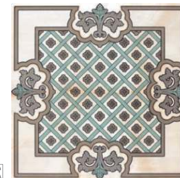
DNK610-248 ALEGORIA 58,5x58,5 BEIGE P41