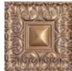
BDL655 I. FRISO 25X25 P37 DORADO