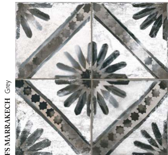
FS MARRAKECH Grey