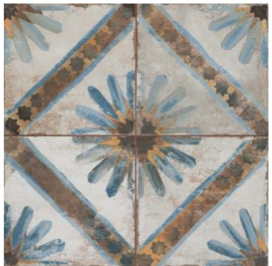
FS MARRAKECH blue