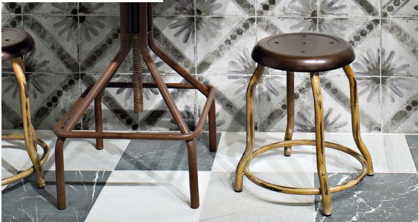
FS MARRAKECH | FS MARRAKECH GREY FS OMEYA GREY, BLACK; WHITE