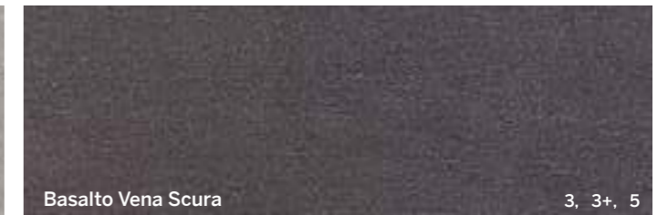
Basalto Vena Scuro