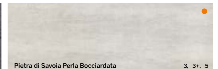
Pietra di Savoia Perla Bocciardata