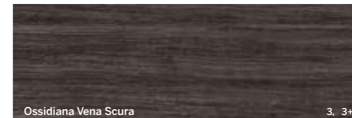
Ossidiana Vena Scuro