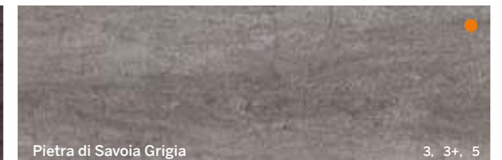
Pietra di Savoia Grigia