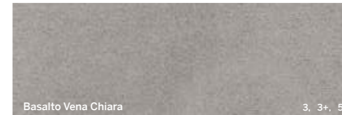
Basalto Vena Chiara

* Гарантируется по требованию на этапе заказа / Guaranteed if requested at the time of ordering.