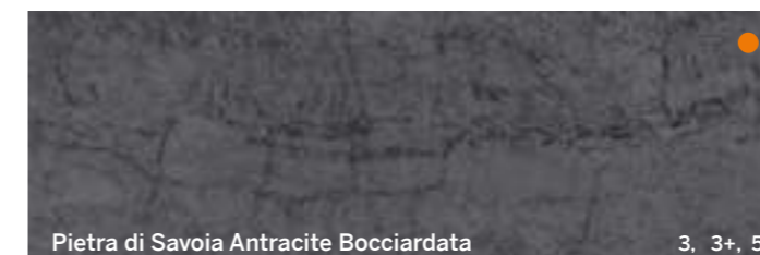
Pietra di Savoia Antracite Bocciardata