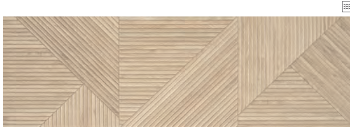
TANGRAM CAMEL 31,6 x 100 R / 12,4" x 39,4"