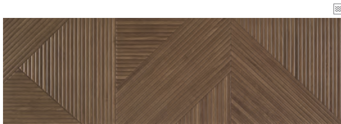
TANGRAM COFFEE 31,6 x 100 R / 12,4" x 39,4"