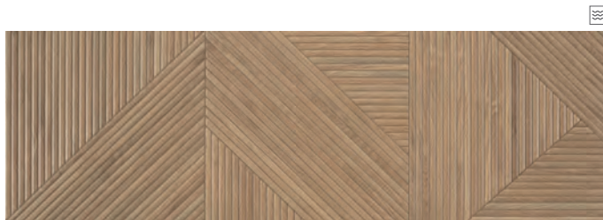
TANGRAM WALNUT 31,6 x 100 R / 12,4" x 39,4"