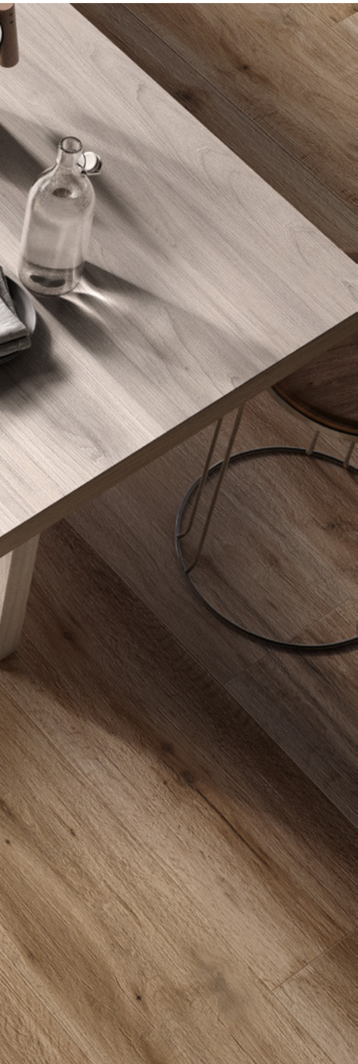
Barkwood Honey 30120