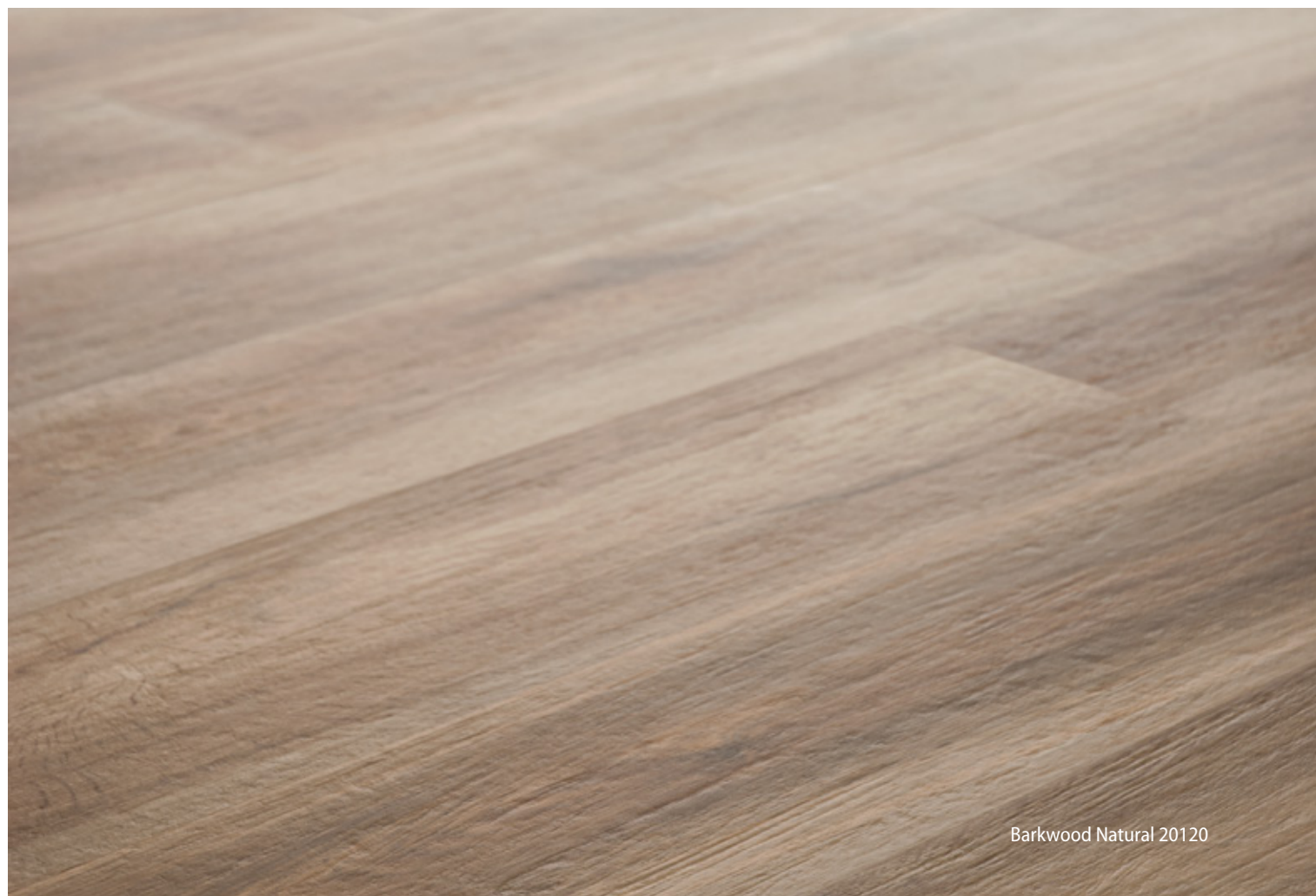
Barkwood Natural 20120