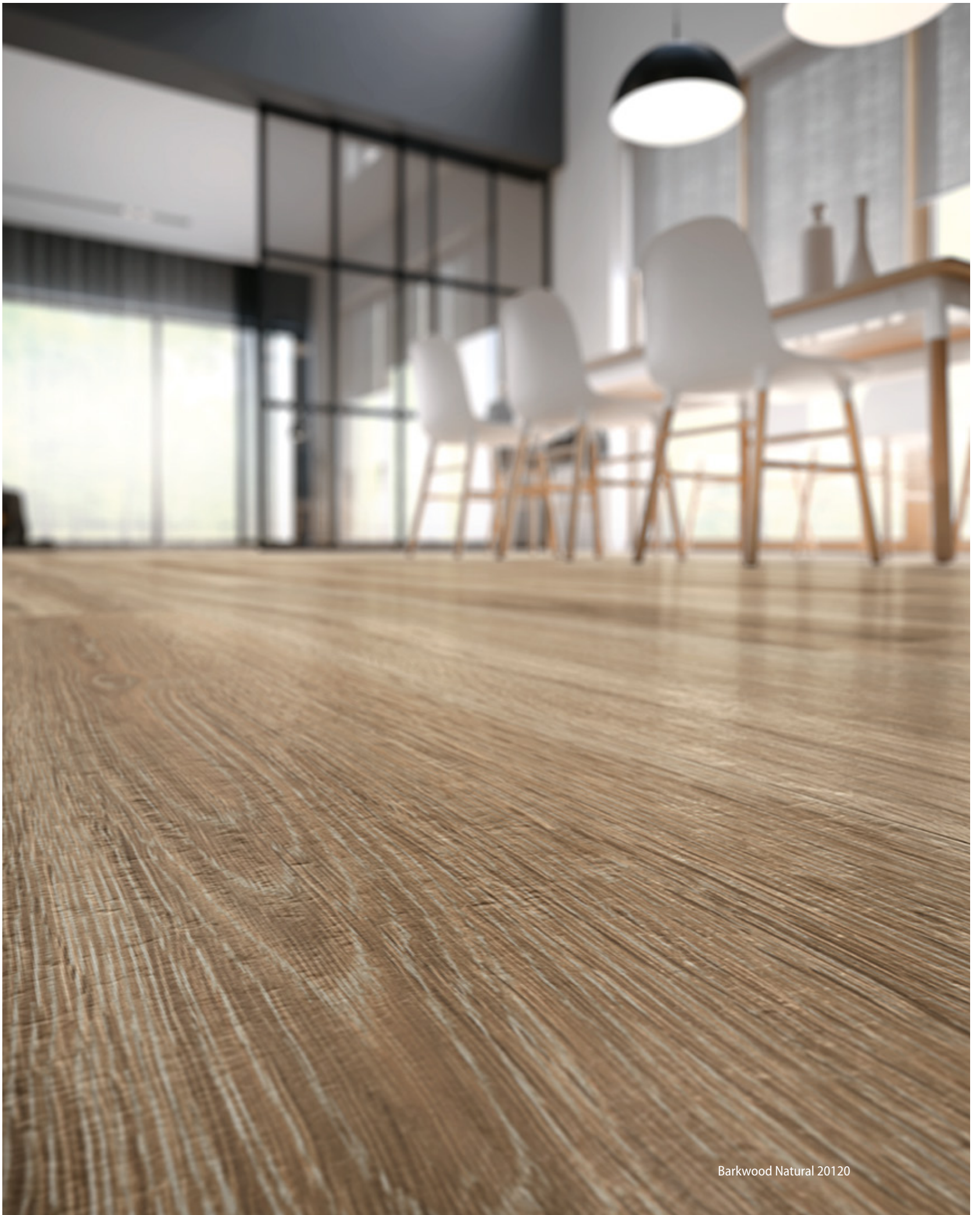
Barkwood Natural 20120