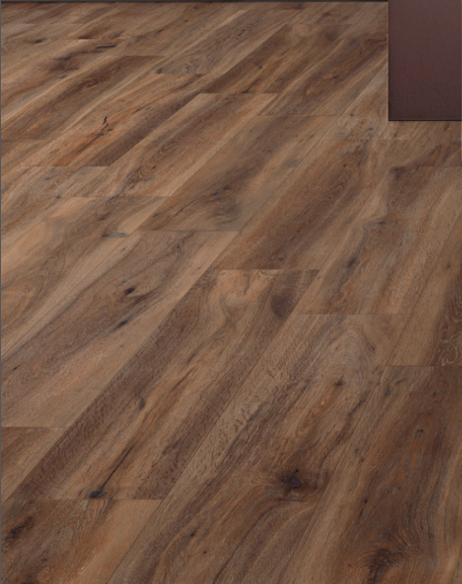
Barkwood Cherry 20120