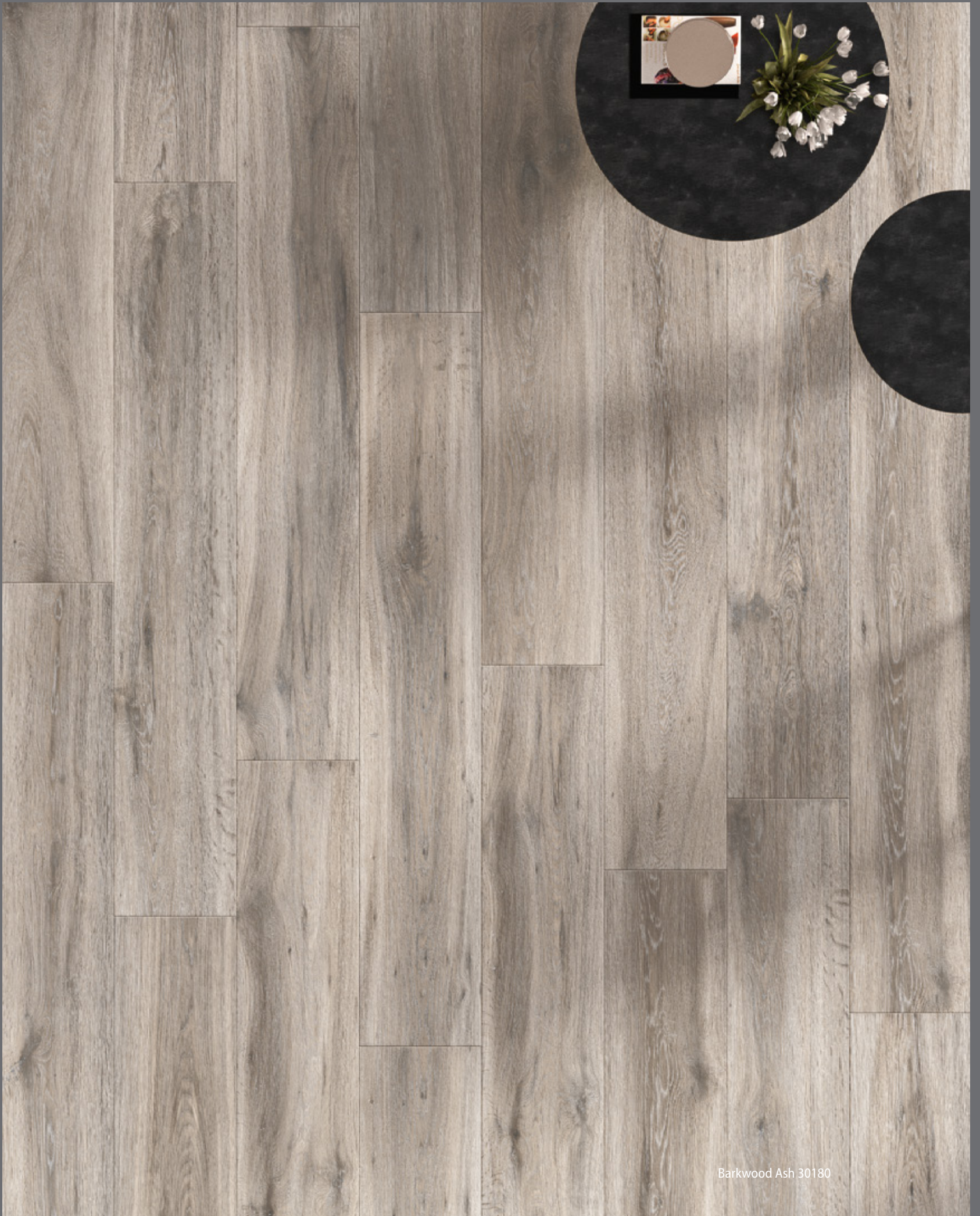
Barkwood Ash 30180