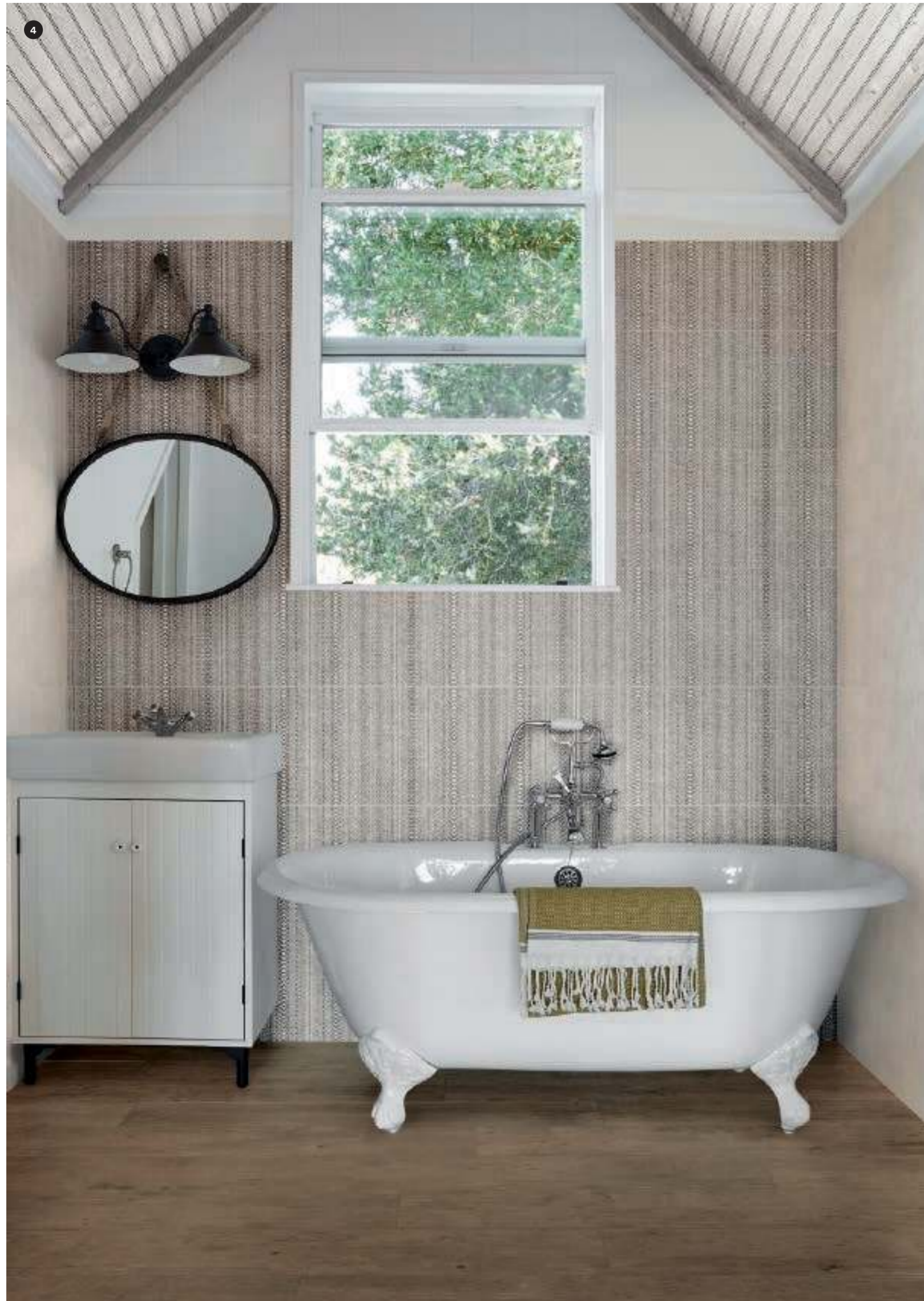
4 MQUT Fabric Cotton 40x120 MEIM Decoro Canvas 40x120 MZUD Treverkdear Brown Rett. 25x150